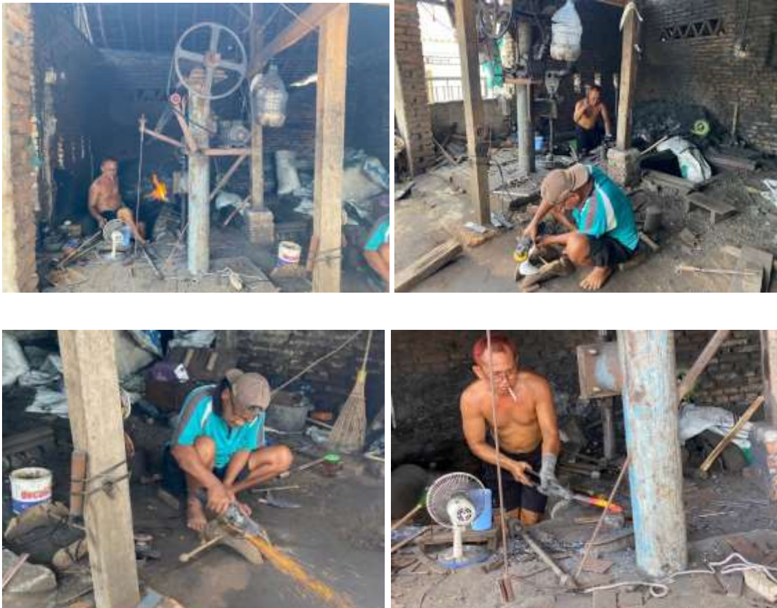
Gambar 2. Proses Pembuatan Pandai Besi di Desa Mangunrejo

bagian penting untuk menjaga reputasi usaha pandai besi di Desa Mangunrejo, meskipun tantangan dalam memperluas pasar digital masih menjadi isu yang perlu segera diatasi untuk mendukung pertumbuhan usaha ke depan (Kufita & Luthfi, 2022). Berikut adalah gambar proses produksi usaha pandai besi di Desa Mangunrejo: