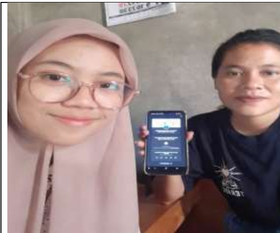
Gambar 3. Pembuatan Alamat Usaha Pandai Besi di Desa Mangunrejo