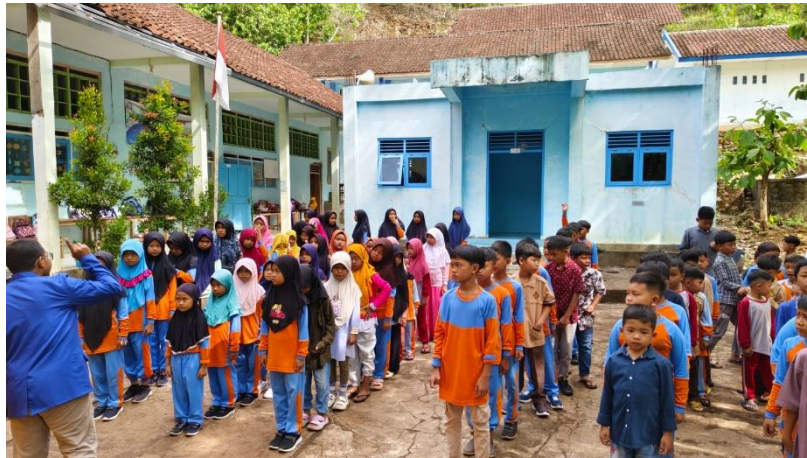
Gambar 3 Pembukaan KUKERTA di SDIT Al-I'tisham

diadakannya beberapa program sekolah ini dapat meningkatkan semangat belajar dan wawasan siswa tentang agama Islam dan bahasa Arab.