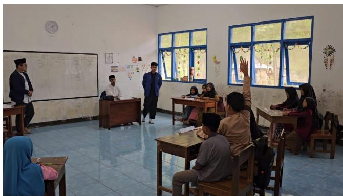
Gambar 1 Suasana Lomba Cerdas Cermat yang berlangsung dengan antusias