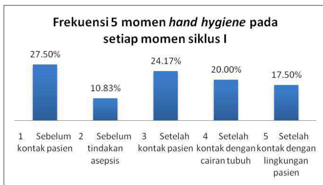
Grafik 2. Frekuensi 5 momen hand hygiene pada setiap momen Siklus I