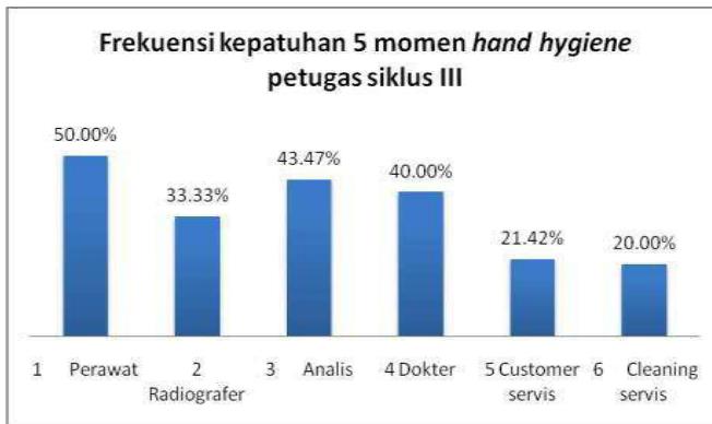
Grafik. 10. Frekuensi kepatuhan 5 momen hand hygiene petugas Siklus III

Kepatuhan paling banyak dilakukan pada momen setelah kontak dengan pasien dan paling sedikit dilakukan pada momen sebelum tindakan aseptik. Dari total kepatuhan semua momen mengalami peningkatan yaitu dari 32,5% pada siklus II menjadi 40,83% pada siklus III.