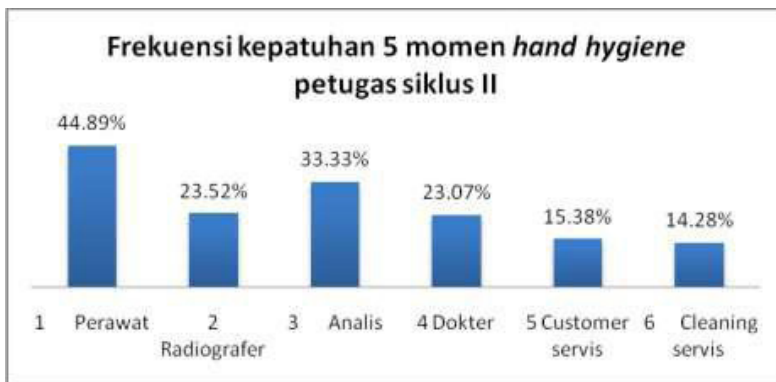
Grafik 7. Frekuensi kepatuhan 5 momen hand hygiene petugas Siklus II

Kepatuhan paling banyak dilakukan pada momen setelah kontak dengan pasien dan paling sedikit dilakukan pada momen sebelum tindakan aseptik. Dari total kepatuhan semua momen mengalami peningkatan yaitu dari 16,67% pada siklus I menjadi 32,5% pada siklus II.