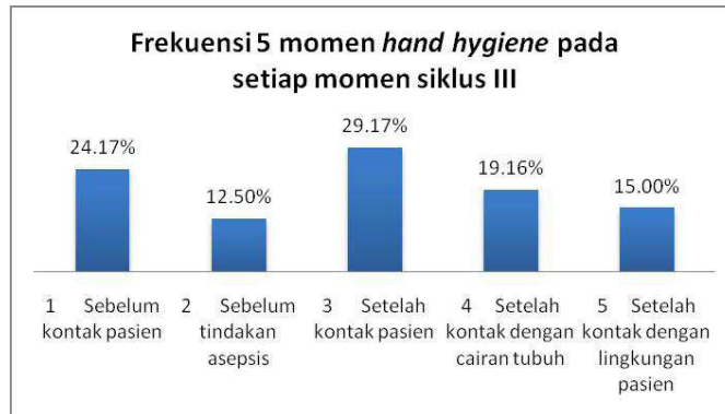
Grafik. 8. Frekuensi 5 momen hand hygiene pada setiap momen Siklus III

Didapatkan hasil momen yang paling banyak terjadi, pada saat siklus III yakni pada momen setelah kontak pasien, sedangkan momen yang paling sedikit terjadi pada momen sebelum tindakan aseptis