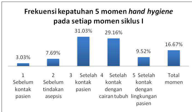
Grafik 3. Frekuensi kepatuhan 5 momen hand hygiene pada setiap momen Siklus

Didapatkan hasil momen yang paling banyak terjadi, pada saat siklus I yakni pada momen sebelum kontak pasien, sedangkan momen yang paling sedikit terjadi pada momen sebelum tindakan aseptis.