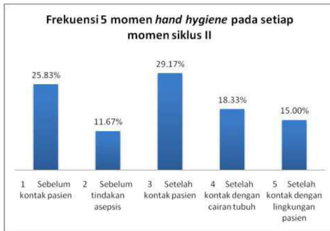
Grafik 5. Frekuensi 5 momen hand hygiene pada setiap momen Siklus II

Didapatkan hasil momen yang paling banyak terjadi, pada saat siklus II yakni pada momen setelah kontak pasien, sedangkan momen yang paling sedikit terjadi pada momen sebelum tindakan aseptis.