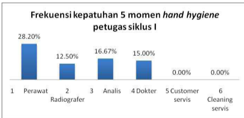
Grafik 4. Frekuensi kepatuhan 5 momen hand hygiene petugas Siklus I

Kepatuhan paling banyak dilakukan pada momen setelah kontak dengan pasien dan paling sedikit dilakukan pada momen sebelum kontak dengan pasien. Setelah dilakukannya intervensi dengan poster peningkatan kepatuhan yang terjadi tidak begitu besar hanya 16,67% dari sebelum intervensi