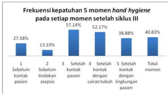
Grafik 9. Frekuensi kepatuhan 5 momen hand hygiene pada setiap Momen siklus III

Didapatkan hasil momen yang paling banyak terjadi, pada saat siklus III yakni pada momen setelah kontak pasien, sedangkan momen yang paling sedikit terjadi pada momen sebelum tindakan aseptis