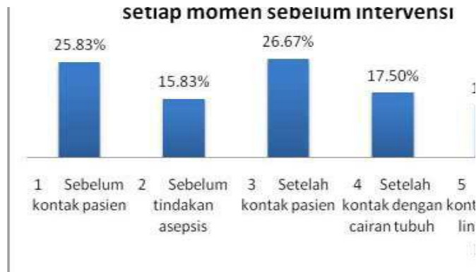
Grafik 1. Frekuensi 5 momen hand hygiene pada setiap momen sebelum intervensi

Momen yang paling banyak terjadi, pada saat sebelum dilakukan intervensi yakni pada momen setelah kontak pasien, sedangkan momen yang paling sedikit terjadi pada momen setelah kontak dengan lingkungan pasien. Sebelum intervensi didapatkan bahwa pada setiap momen tidak ada yang patuh melakukan hand hygiene secara benar sesuai dengan standar WHO.