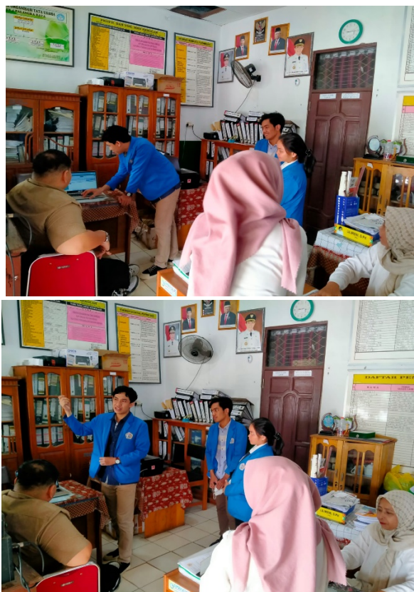
Gambar. 5 Kegiatan Sosialisai