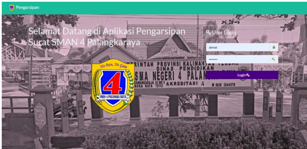
Gambar. 2 Halaman login

Halaman login merupakan tampilan awal dari aplikasi ini dimana pengguna diwajibkan untuk mengisi username dan password untuk masuk ke dalam aplikasi.