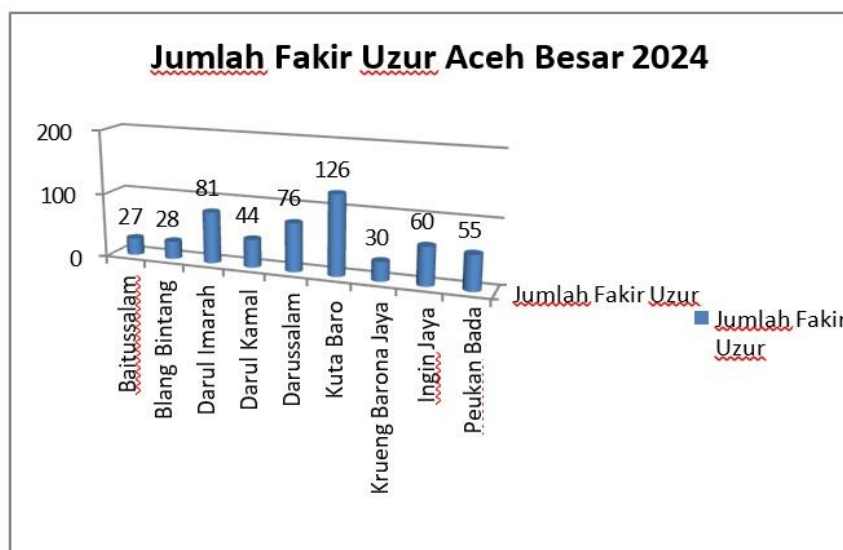
Gambar 1. Data penerima program zakat fakir uzur per kecamatan tahun 2024

Gambar 1 menunjukkan sebaran penerima fakir uzur pada tiap kecamatan di Banda Aceh dan Aceh Besar. Banda Aceh terdiri atas 9 kecamatan dan Aceh Besar terdiri atas 9 kecamatan. Total mustahik uzur berjumlah 585 orang, dengan rincian berdomisili di Banda Aceh berjumlah 58 orang, sedangkan berdomisili di Aceh Besar berjumlah 527 orang, berjenis kelamin Laki-laki berjumlah 184 orang dan berjenis kelamin perempuan berjumlah 401 orang.