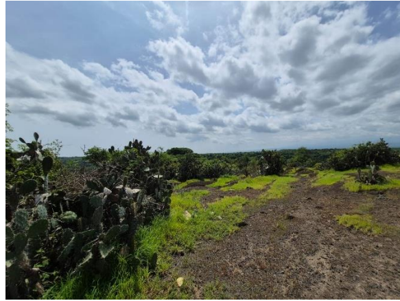
Gambar 2. Lokasi di Sekitar Situs Makam dengan Kontur Perbukitan dan Lembah

Program Pengabdian yang akan dilaksanakan ini dapat menyentuh permasalahan riil yang terjadi di masyarakat Desa Kotakan melalui peningkatan kapasitas Kelompok Sadar Wisata agar mampu menjadi agen perubahan dan agen solusi dalam membangun pusat-pusat sosial ekonomi baru secara kreatif dan berkearifan lokal sehingga terjadi peningkatan kesejahteraan serta kemandirian wilayah Desa Kotakan untuk membantu meningkatkan kemandirian kabupaten serta memitigasi risiko berkembangnya bisnis prostitusi. Kegiatan Pengabdian kepada Masyarakat ini dilakukan dengan pendekatan Asset Based Community Development (ABCD) dengan Integrasi Kegiatan dari Hulu ke Hilir sebagai berikut: