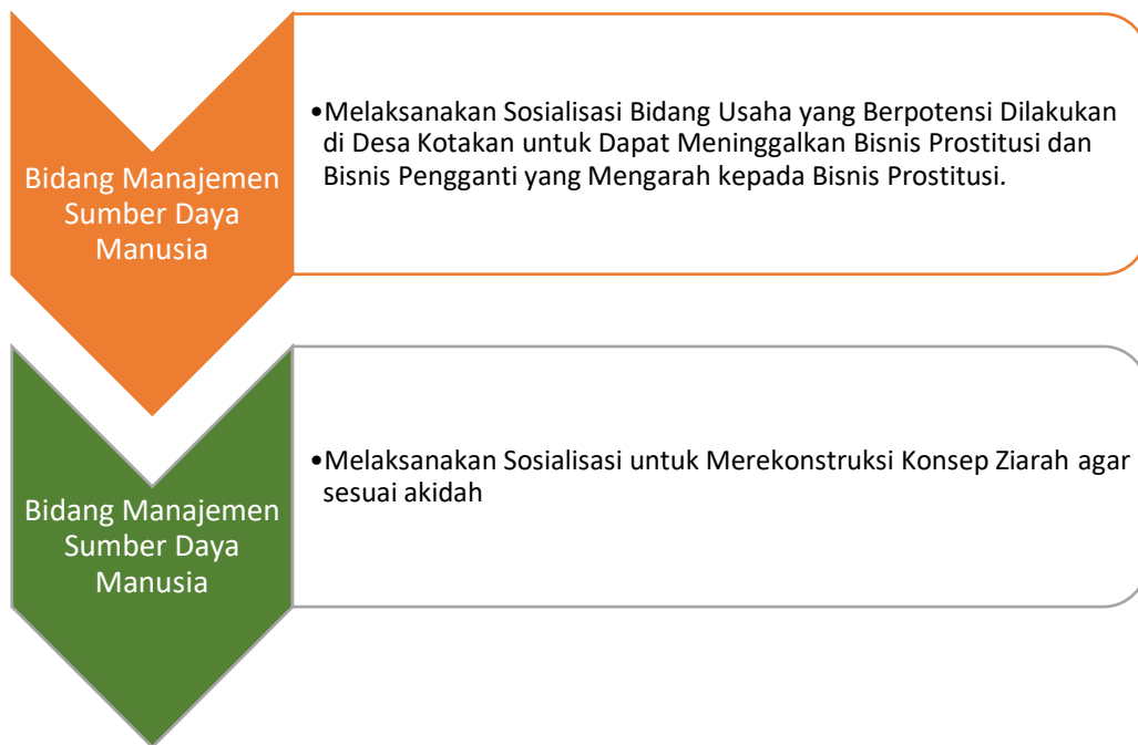
Gambar 4. Solusi Atas Sumber dari Permasalahan Prioritas Utama

Setiap kegiatan dihadiri dan diikuti secara antusias oleh 95% peserta dari keseluruhan undangan. Berikut ini adalah Dokumentasi Kegiatan: