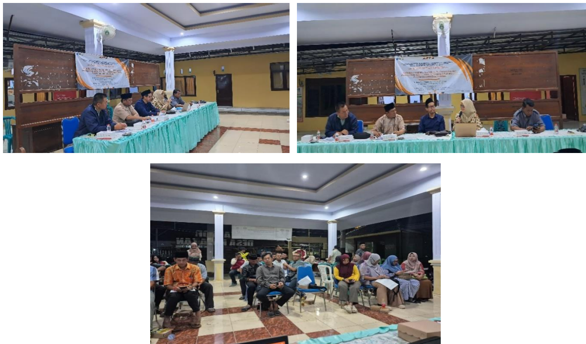
Gambar 5. Dokumentasi Kegiatan

Setiap kegiatan dihadiri dan diikuti secara antusias oleh 95% peserta dari keseluruhan undangan. Berikut ini adalah Dokumentasi Kegiatan: