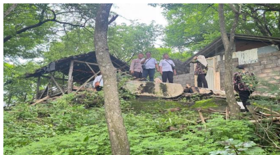
Gambar 1. Bukit Situs Makam “Bujuk Nur Kasian”

Pada Gambar 1 dan Gambar 2 terlihat lokasi perbukitan wisata religi. Potensi wisata yang dapat dikembangkan adalah berupa kegiatan yang berelasi dengan religi, dengan upaya mengadakan acara yang berpotensi mendatangkan banyak pengunjung, yaitu “One Night Muhasabah Glamping in Bujuk Nur Kasian” “Tadabur Trail Run” di kawasan situs dengan tujuan akhir di bukit. Selain itu juga kegiatan berpotensi ekonomi semisal Festival Balon Udara maupun Festival Layangan.