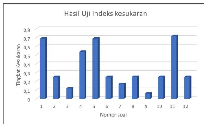
Gambar 2. Hasil Uji indeks kesukaran

Berdasarkan perhitungan validitas menggunakan bantuan software Microsoft Excel , menunjukkan bahwa soal nomor 2, 3, 6, 7, 8, 9, 10 dan 12 memiliki indeks kesukaran sukar, soal nomor 1, 4 dan 5 memiliki indeks kesukaran sedang, dan soal nomor 11 memiliki indeks kesukaran mudah. Hal ini semua soal yang dikembangkan dapat untuk mengukur kemampuan literasi matematika siswa. Selain itu, hasil uji indeks kesukaran disajikan pada Gambar 2 berikut.