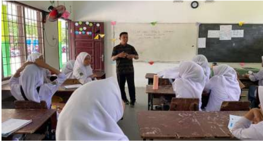
Gambar 3: Contoh Latihan Public Speaking oleh Mahasiswa Universitas Asahan

Doi : https://doi.org/10.47709/ppi.v3i03.6972