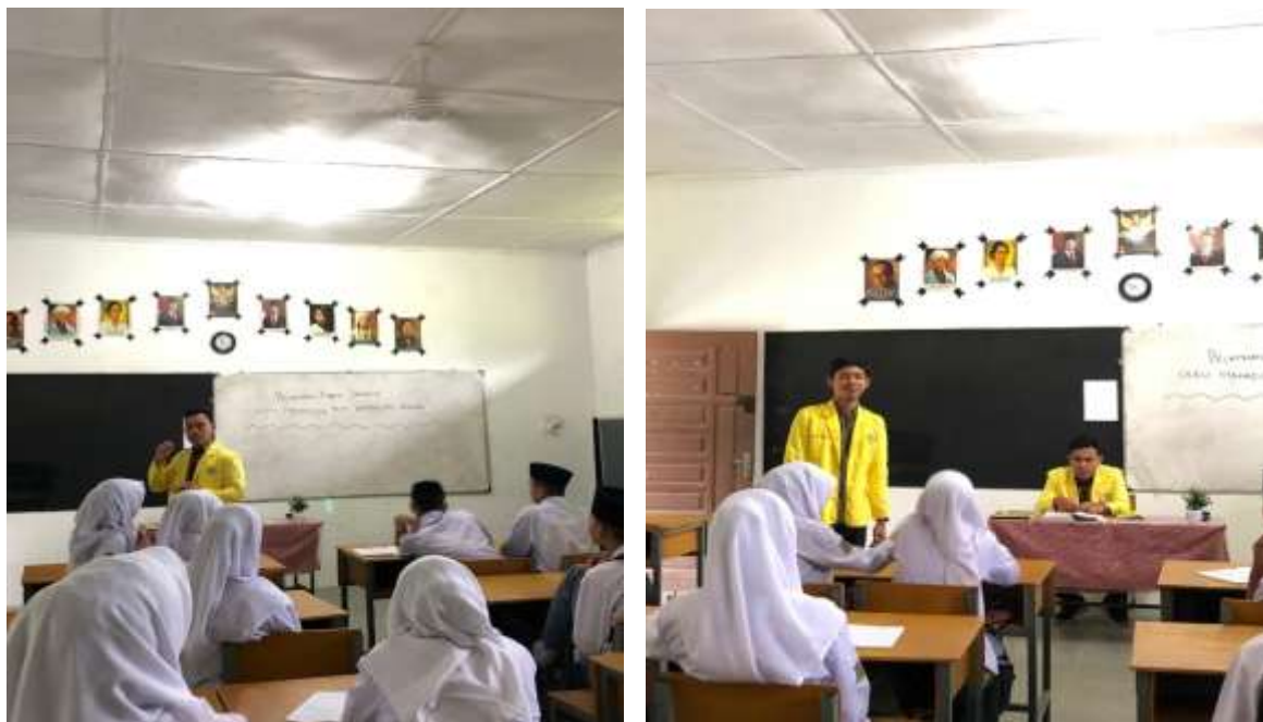
Gambar 1 dan 2: Penyampaian materi dasar Public Speaking

Dengan demikian, realisasi kegiatan pengabdian ini tidak hanya berdampak pada peningkatan kemampuan public speaking siswa, tetapi juga memberi pengalaman berharga bagi mahasiswa PLPT dalam mengimplementasikan ilmu dan keterampilan pedagogis yang mereka pelajari di bangku kuliah.