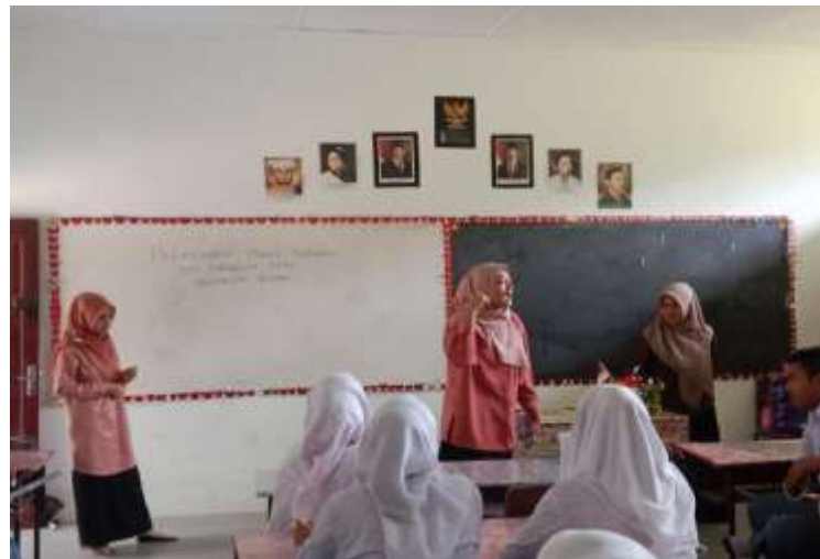
Gambar 4: Contoh Latihan Public Speaking oleh Mahasiswa Universitas Asahan