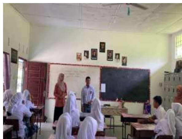
Gambar 5 dan 6: Praktik Public Speaking oleh Siswa/i Mas Daarul Falah