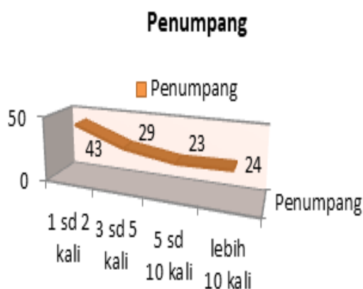
Gambar 3 Jumlah responden naik pesawat per tahun

Informasi ini menunjukkan bahwa masyarakat di Kabupaten Halmahera Utara hampir 50% melakukan perjalanan dengan transportasi udara 1 kali dalam dua bulan dan hal ini merupakan peluang bagi industri penerbangan jika mampu menawarkan jenis pesawat dan rute layanan yang tepat. Untuk jelasnya dapat dilihat pada Gambar 3