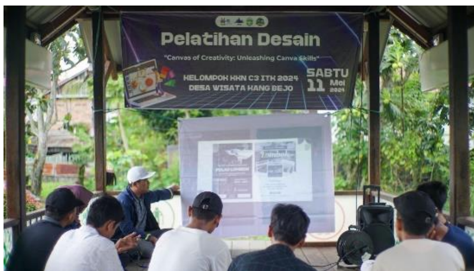
Gambar 2. Pelaksanaan Pelatihan Desain

Pelatihan desain menggunakan aplikasi Canva yang diikuti oleh masyarakat Desa Wisata Kang Bejo sebanyak 8 orang dengan rentang umur 12 tahun - 19 tahun. Pelatihan desain dilaksanakan pada hari Sabtu, 11 Mei 2024. Dalam pelatihan ini para peserta diberikan materi mengenai teori dasar terkait estetika desain dan tren terbaru desain di tahun 2024, kemudian peserta juga melakukan simulasi menggunakan aplikasi canva untuk membuat desain yang menarik.