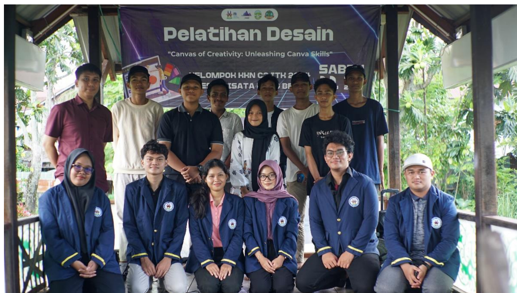
Gambar 3. Peserta Pelatihan Desain

Pada pelatihan ini peserta diberikan pertanyaan untuk melihat peningkatan pemahaman terkait desain. Pertanyaan ini diberikan sebelum dan sesudah penyampaian materi diberikan. Adapun pertanyaan yang diberikan adalah sebagai berikut.