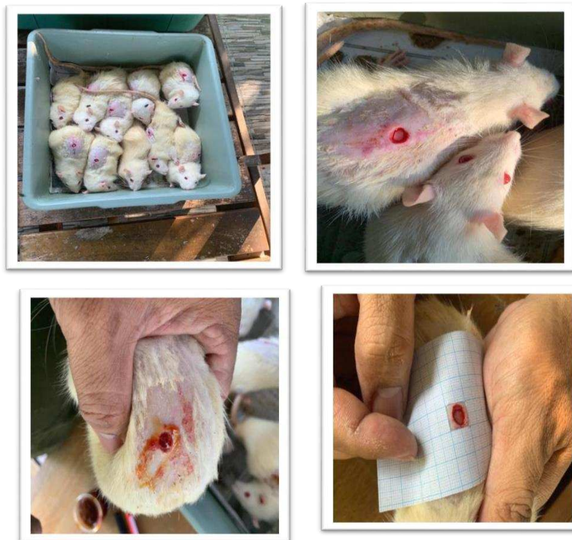
Gambar 2. Pengujian Efektivitas Nanoemulgel Ekstrak Umbi Bawang Dayak Terhadap Luka Biopsy Tikus