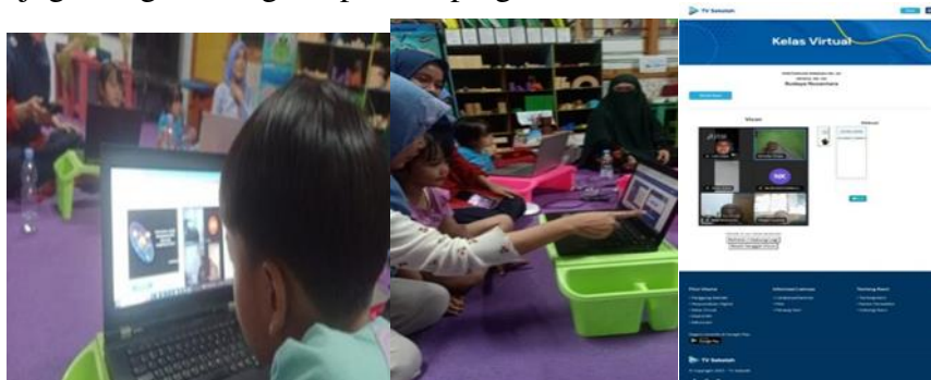
Gambar 5. Suasana Pembelajaran dengan Kelas Virtual TV Sekolah (CL. 2)

Berdasarkan CL 1, terlihat bagaimana tampilan modul ajar di kelas virtual yang bisa jadi materi pembelajaran guru dan para siswa. Materi yang beragam dengan tampilan yang menarik. Kelas virtual yang menarik dan beragam mampu meningkatkan kreativitas dan kemampuan bahasa guru dan murid. Pengucapan kosakata yang jelas dan intonasi yang tepat saat menyampaikan materi, baik dalam modul maupun di kelas virtual, akan menjadi contoh bagi murid. Pembelajaran dengan teknologi seperti TV virtual membuka peluang inovasi dan kreatifitas dalam mengembangkan pola pikir siswa. TV virtual juga memungkinkan murid untuk belajar di mana dan kapan saja, menjadikannya sistem pembelajaran yang efektif dan fleksibel (Ristiyana et al., 2023). Adanya ruang Vicon, membuat interaksi antara guru dan murid bahkan juga dengan orang tua/pendamping anak/murid.