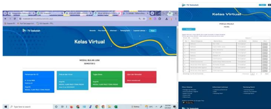
Gambar 3. Kelas Virtual TV Sekolah (CD. 3)

Berdasarkan CD 3, terlihat fitur yang ada di kelas virtual, sesuai dengan tahapan pelaksanaan pada CD 2. Seperti jadwal pertemuan dan materi, diskusi dan Vicon, tugas siswa dan Ujian dan remedial. Termasuk pilihan modul sesuai pertemuan 1-10 yang sudah dientri. Dari gambar diatas terlihat jelas bahwa Kelas Virtual TV Sekolah merupakan program LCMS TV Sekolah yang dirancang untuk menghadirkan solusi pembelajaran yang lebih efektif dan terintegrasi di era digital. Platform ini memungkinkan peserta didik dan pengajar dari berbagai tingkatan pendidikan, mulai dari PAUD hingga perguruan tinggi, untuk terlibat dalam proses belajar mengajar secara daring. Dengan memanfaatkan teknologi informasi, Kelas Virtual TV Sekolah menyediakan ruang belajar online yang mudah diakses dan dimanfaatkan oleh seluruh elemen pendidikan. Hal ini memungkinkan terciptanya proses belajar mengajar yang lebih fleksibel, interaktif, dan berpusat pada peserta didik (Emelda et al., 2024). Interaksi antara peserta didik dan pengajar memfasilitasi terciptanya komunikasi dua arah. Komunikasi timbal balik ini berperan penting dalam membangun kemampuan komunikasi anak.