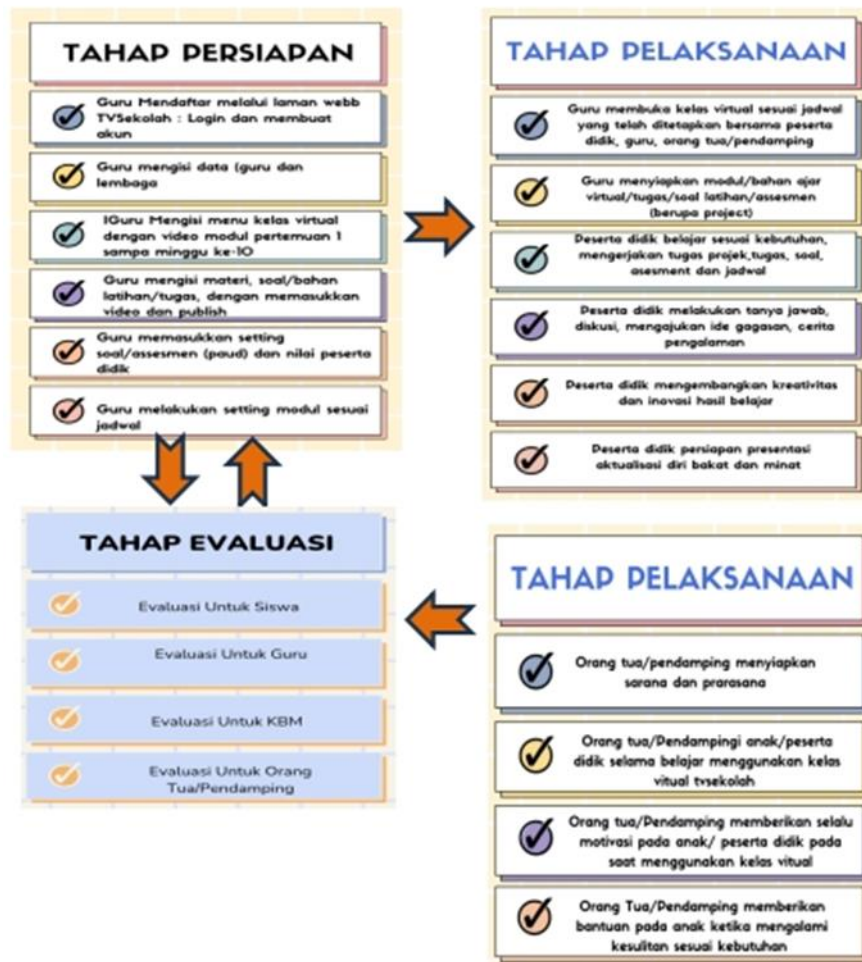
Gambar 2. Konsep Pengembangan Kelas Virtual TV Sekolah (Watini, 2023) (CD. 2)

Berdasarkan CD 2, Ada tahapan persiapan, tahap pelaksanaan dan tahap evaluasi. Tahap Persiapan meliputi : guru mendaftar melalui laman web TV Sekolah : Login dan membuat akun. Kemudian guru mengisi data guru dan lembaga. Selanjutnya guru mengisi menu kelas virtual dengan video modul pertemuan 1-10. Kemudian guru mengisi materi, soal/bahan, latihan/tugas, dengan memasukkan video dan publish. Selanjutnya guru memasukkan setting soal/assesmen PAUD dan nilai peserta didik. Dilanjutkan dengan guru melakukan setting jadwal. Pada Tahap Pelaksanaan guru membuka kelas virtual sesuai jadwal yang sudah ditetapkan bersama peserta didik, guru, orang tua/pendamping. Guru menyiapkan modul/bahan ajar virtual/tugas/soal latihan/assesmen berupa project. Peserta didik belajar sesuai kebutuhan mengerjakan tugas projek, soal/assesmen, dan jadwal. Peserta didik melakukan tanya jawab, diskusi, mengajukan ide gagasan dan cerita pengalaman. Peserta didik mengembangkan kreasi dan inovasi hasil belajar. Peserta didik melakukan persiapan aktualisasi dari bakat dan minat. Pada Tahap Pelaksanaan orang tua/ pendamping menyiapkan sarana dan prasarana. Orang tua/pendamping peserta didik selama belajar menggunakan kelas virtual per sekolah. Orang tua/pendamping peserta didik memberikan motivasi kepada anak/peserta didik, memberi bantuan kepada anak ketika mengalami kesulitan sesuai kebutuhan. Selanjutnya adalah tahap evaluasi. Evaluasi terhadap guru, anak, KBM, dan orang tua/pendamping.