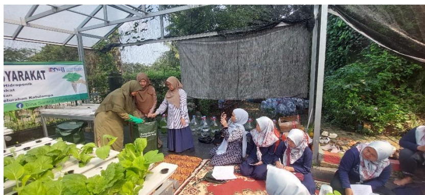
Gambar 2. Kegiatan Pembuatan Pupuk Organik

Hasil pre test dan post test yang diberikan oleh tim pelaksana berupa kuesioner kepada peserta pendampingan yaitu anggota kelompok tani hydromadam yang berisi tiga buah indikator penilaian. Pengolahan data menggunakan bantuan Microsoft Excel. Untuk mengetahui capaian persentase dalam pendampingan dan pelatihan pengelolaan sampah organik yang diberikan kepada mitra kelompok tani hydromadam Katu Lampa Bogor. Kuesioner meliputi pengetahuan tentang manfaat sampah organik, pengetahuan tentang alat dan bahan yang digunakan untuk pengolahan sampah organik, dan tata cara pengolahan sampah organik yang dapat menghasilkan pupuk organik.