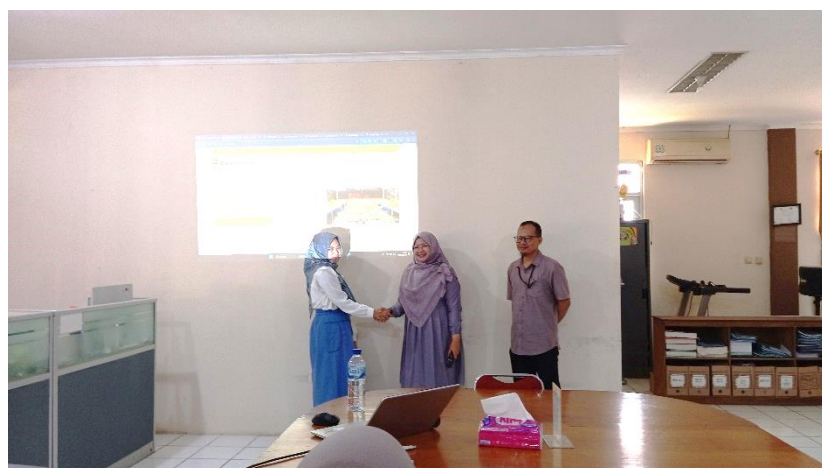
Gambar 5. Serah Terima Web dari Panitia kepada Ketua Hydromadam

Pendampingan penggunaan website hydromadam dan aplikasi kas kecil dapat diterima dengan baik oleh para peserta, karena website hydromadam ini dapat dibuka dari smartphone. Suasana pendampingan dapat dilihat pada Gambar 4. Pendampingan dilanjutkan dengan sesi tanya jawab dan diskusi, para peserta sangat aktif bertanya dan berdiskusi terkait pengelolaan penjualan tanaman hidroponik, pengelolaan laporan keuangan hydromadam.