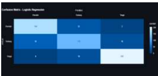
Gambar 7. Confusion Matrix Model Logistic Regression

Pola klasifikasi untuk SVM dan Logistic Regression dapat dilihat masing-masing pada Gambar 7 dan Gambar 8.