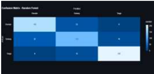
Gambar 6. Confusion Matrix Model Random Forest

Sebagai pembandingan, performa model Random Forest disajikan pada Gambar 6.