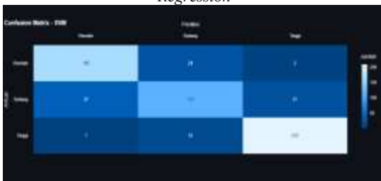
Gambar 8. Confusion Matrix Model SVM

Kedua model menunjukkan pola yang mirip dengan Random Forest dalam mengidentifikasi kelas "Tinggi", dengan SVM mencatat 210 prediksi yang benar dan Regresi Logistik 205 prediksi yang benar. Namun, keduanya juga menghadapi kesulitan yang sama seperti Decision Tree dalam membedakan batas kabur antara kelas "Rendah" dan "Sedang", meskipun tidak signifikan kesalahan pada Decision Tree .