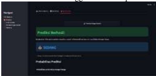
Gambar 4. tampilan hasil prediksi kategori

Di sisi kiri layar, terdapat menu interaktif yang memungkinkan pengguna beralih ke bagian lain seperti Analisis Data, Perbandingan Model, dan Tentang Aplikasi. Desain aplikasi responsif dan tertata dengan baik, sehingga lebih mudah dan alami bagi pengguna untuk memahami dan menggunakan hasil prediksi.