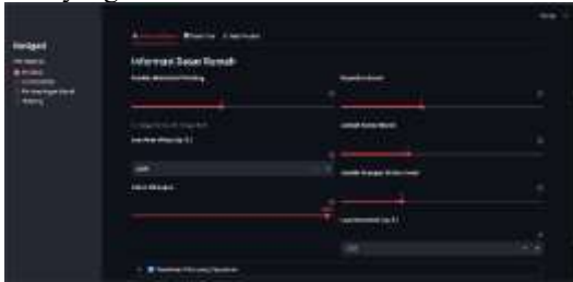
Gambar 3. Tampilan Antarmuka Input Data

Pengaturan ini memudahkan pengguna memasukkan data dengan jelas dan efektif, membantu memastikan prediksi yang akurat.