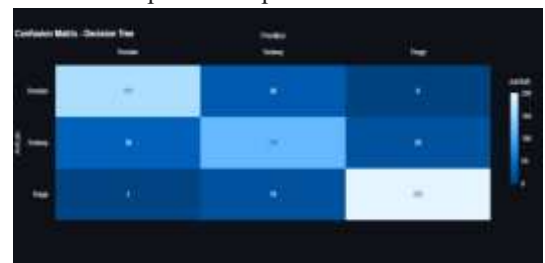
Gambar 5. Confusion Matrix Model Decision Tree

Visualisasi Confusion Matrix untuk model Decision Tree dapat dilihat pada Gambar 5.