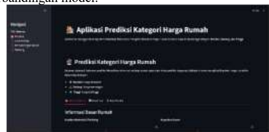
Gambar 2. Tampilan Interface Aplikasi St

Aplikasi ini dirancang untuk memudahkan pengguna memprediksi kategori harga rumah berdasarkan atribut yang relevan. Pengguna dapat memasukkan informasi rumah seperti kualitas material, luas bangunan, dan kapasitas garasi untuk mendapatkan hasil klasifikasi ke dalam tiga kategori harga: Rendah, Sedang, dan Tinggi. Antarmuka aplikasi utama dapat dilihat pada Gambar 2, yang menunjukkan antarmuka halaman prediksi beserta navigasi ke halaman analisis data dan perbandingan model.