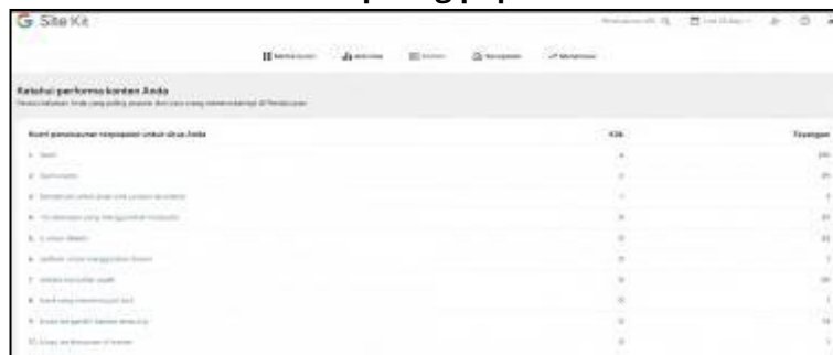
Gambar 3. Kata kunci paling populer di website ITech

Dalam konteks cyber PR, SEO berfungsi sebagai saluran komunikasi tidak langsung yang menghubungkan audiens dengan informasi yang relevan. Keyword stuffing harus dihindari karena dapat menurunkan kepercayaan pengguna. Oleh karena itu, strategi SEO yang digunakan tidak hanya fokus pada algoritma mesin pencari, tetapi juga mempertimbangkan kepuasan pengguna. Kolaborasi antara tim teknis dan komunikasi menjadi penting untuk menyeimbangkan antara aspek search engine-friendly dan user-friendly.