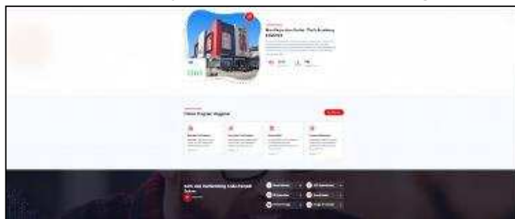
Gambar 5. Layout Website Dan Web Design Itech

Penyampaian nilai juga dilakukan melalui storytelling dalam bentuk testimoni, studi kasus, dan artikel blog. Meski testimoni alumni masih terbatas, strategi ini dinilai efektif dalam membangun kepercayaan dan menjembatani hubungan emosional dengan pengguna. Elemen komunikasi verbal dan visual dipadukan untuk menciptakan narasi yang menarik dan mudah diingat. Dengan pendekatan ini, website tidak hanya menyampaikan informasi, tetapi juga memperkuat kredibilitas perusahaan.