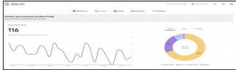
Gambar 4. Penggunaan Google Analytics di website ITech