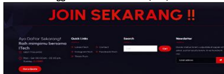
Gambar 7. Penggunaan Call-to-Action (CTA) di website ITech

CTA digunakan untuk mendorong pengunjung website melakukan tindakan tertentu seperti mendaftar, menghubungi, atau membaca lebih lanjut. Tombol CTA memperhatikan aspek visual seperti warna mencolok dan teks persuasif. Penempatan CTA pada lokasi strategis seperti header atau akhir artikel dinilai efektif dalam menarik perhatian audiens. CTA dipandang sebagai alat bantu operasional yang menyederhanakan proses interaksi pengguna. Strategi CTA yang baik dapat menurunkan bounce rate dan meningkatkan konversi. Dalam konteks komunikasi, CTA berperan sebagai penghubung antara pesan yang disampaikan dan aksi nyata dari audiens. Penyesuaian CTA dengan konten di sekitarnya menjadi kunci agar pesan tidak terasa memaksa, tetapi sebagai solusi yang relevan dan bermanfaat.