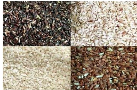
Gambar 3. Variasi beras organik (beras hitam, coklat, mentik, dan beras merah)

an beras organik agar mampu berkompetisi di pasar luas.