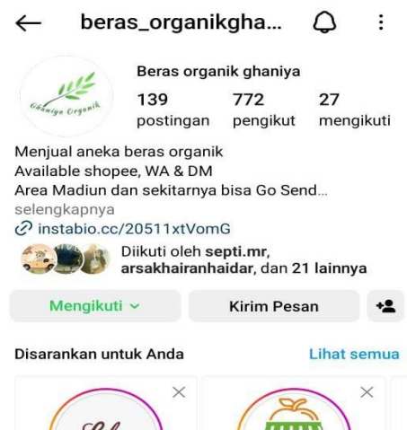
Gambar 6. Media sosial instagram beras organik hasil produksi beras organik kelompok tani sejahtera

Peran media online dan e-commerce ini dapat membantu petani dalam menjual produknya dan memangkas saluran distribusi yang sebelumnya melalui tengkulak atau supplier bisa hanya dari produsen ke konsumen secara langsung (Sanjaya, 2022). Digital Marketing adalah suatu