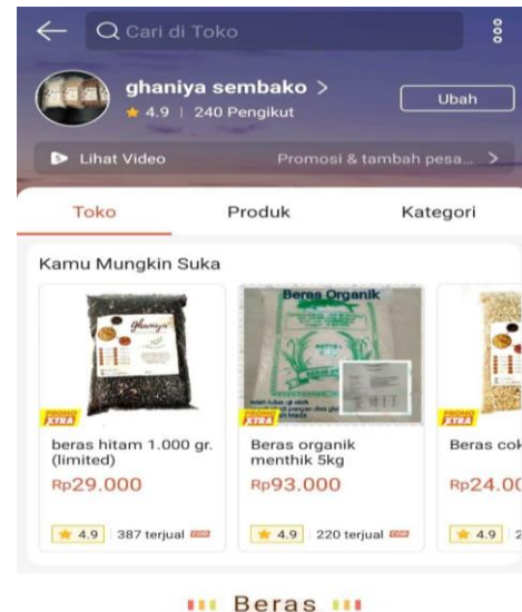
Gambar 5. E-Commerce produk beras organik

blog yang dapat di cari dalam mesin pencarian google. Cara ini dapat membantu pelaku usaha khususnya para petani dalam mengenalkan produknya sekaligus untuk melakukan digital marketing (Anggraini et al., 2020). Platform belanjaan online memainkan peran yang semakin meningkat di sektor pangan di banyak negara. Strategi penetapan harga dilakukan oleh banyak platform online untuk menarik pembeli dibandingkan penjualan yang dilakukan secara offline (Hillen and Fedoseeva, 2021).