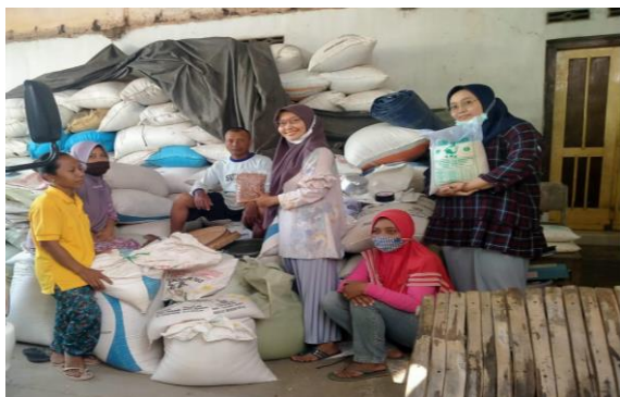
Gambar 2. Sosialisasi dan pendampingan kepada anggota kelompok Tani

Produksi beras organik dari kelompok tani sejahtera desa Kaibon sangat bervariasi, dan karena inovasinya mengenai variasi beras ini mempunyai pasar yang sangat potensial untuk dikembangkan. Beras organik yang dihasilkan dapat menjadi nilai tambah serta meningkatkan pendapatan petani (Gambar 3). Diperlukan pemasaran yang baik guna menunjang penjual-