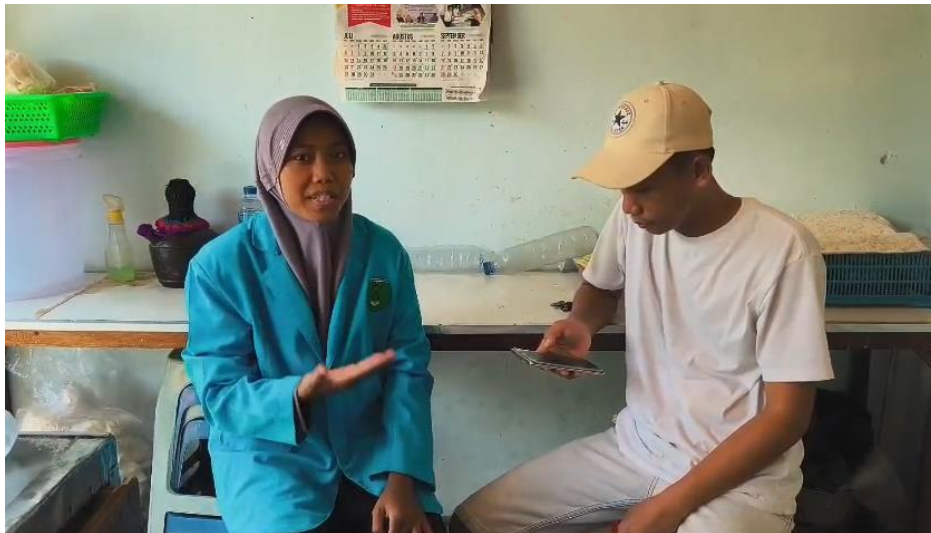
Gambar 4. Pendampingan Penggunaan Aplikasi Swa-Commerce

Dari program pendampingan, UMKM telah berhasil mengoperasikan platform Swa-E-Commerce mandiri (website toko online) untuk menerima pesanan langsung dari pelanggan. Hal ini menghilangkan ketergantungan pada platform pihak ketiga seperti GoFood atau GrabFood, sehingga menghemat biaya komisi 15-30% per transaksi. Penghematan ini dialihkan untuk meningkatkan modal usaha atau menawarkan harga lebih kompetitif kepada pelanggan.