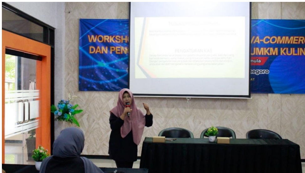
Gambar 3. Pelaksanaan Workshop Pencatatan Keuangan bagi UMKM

Pelatihan bertujuan untuk memberdayakan pelaku UMKM kuliner Maliogoro dengan kemampuan mengelola keuangan usaha secara sistematis dan transparan, melalui pelatihan pencatatan keuangan dasar berbasis digital (seperti penggunaan aplikasi sederhana atau spreadsheet) yang fokus pada pemisahan keuangan pribadi dan usaha, pelacakan arus kas, serta penghitungan biaya produksi secara akurat (Safii et al., 2024).