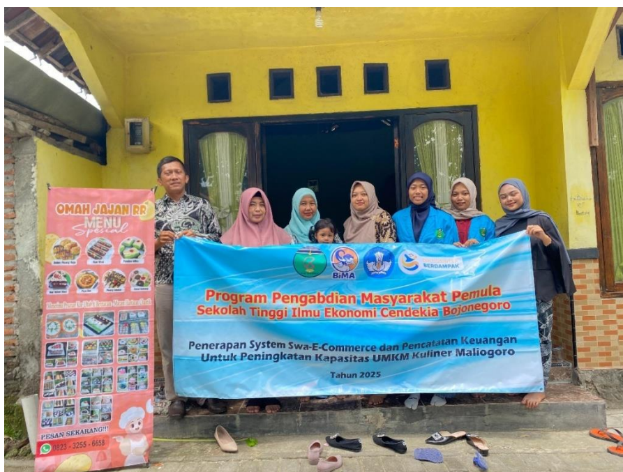
Gambar 5. Pendampingan Manajemen Usaha untuk UMKM

Pendampingan yang dilakukan setelah pelatihan memberikan dampak positif yang signifikan bagi pelaku UMKM kuliner Maliogoro. Selama proses pendampingan, tim pengabdian secara intensif memberikan bantuan teknis dan konsultasi dalam mengoperasionalkan strategi yang telah diajarkan. Sebagai contoh, awalnya beberapa pelaku UMKM mengalami kesulitan dalam mengelola pesanan yang masuk melalui platform Swa-E-Commerce bersamaan dengan pesanan langsung di lokasi. Melalui pendampingan, mereka berhasil mengembangkan sistem antrian dan manajemen waktu yang efektif, termasuk penjadwalan khusus untuk memproses pesanan online pada jam-jam tertentu sehingga tidak mengganggu layanan terhadap pengunjung langsung.