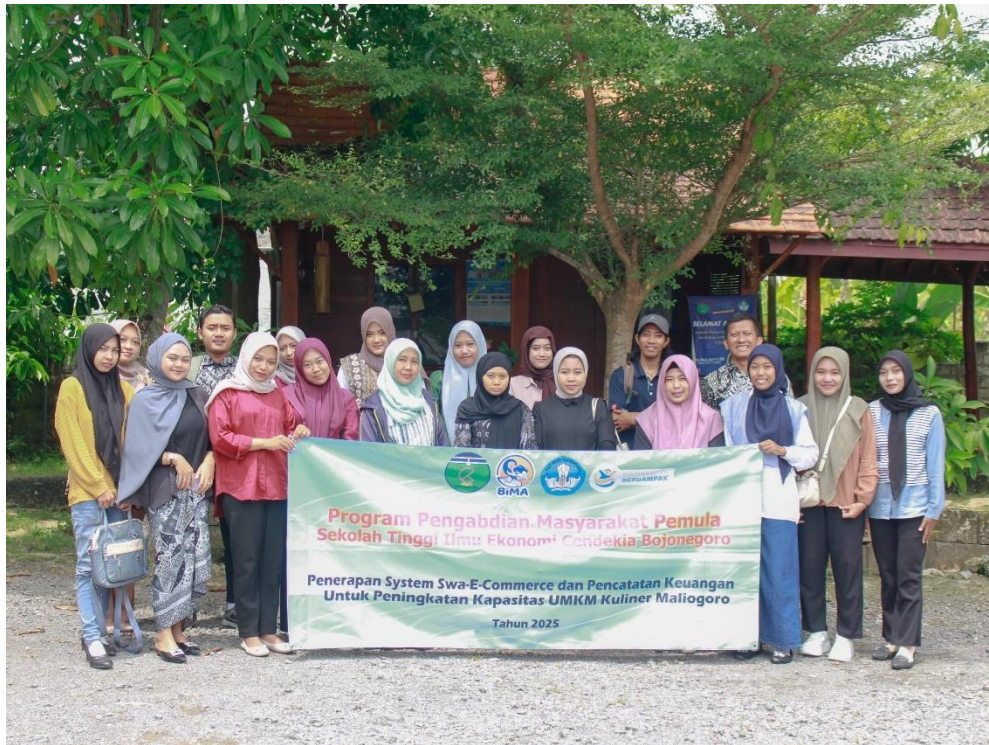
Gambar 1. FGD Kebutuhan dan fitur Aplikasi Penjualan Makanan dan Minuman Online

Tahap kedua adalah pelaksanaan pelatihan dan workshop. Kegiatan ini dibagi menjadi dua bagian utama, yaitu pelatihan pengelolaan dan perencanaan keuangan. Dalam pelatihan manajemen usaha, para pelaku UMKM diajarkan mengenai pengelolaan keuangan, pemisahan modal usaha dan keuangan pribadi, serta manajemen persediaan usaha. Tujuan dari pelatihan ini adalah untuk meningkatkan efisiensi dan efektivitas operasional para UMKM, serta peningkatan kemampuan akses permodalan perbankan dengan adanya catatan keuangan usaha (Hidayatin et al., 2022).