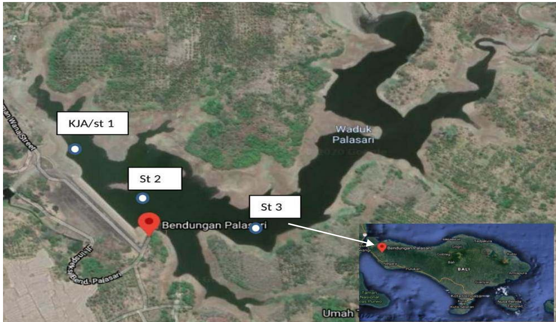
Gambar 1. Peta Waduk/ Bendungan Palasari

Pada uji pertumbuhan dilakukan dengan pengukuran panjang dan pengukuran bobot pada masing-masing perlakuan yang diberikan setiap satu minggu sekali terhitung dari awal ikan masuk ke wadah perlakuan. Setelah didapatkan data setiap minggunya maka dilakukan perhitungan pertumbuhan panjang mutlak, pertumbuhan bobot mutlak, laju pertumbuhan dan kelangsungan hidup.