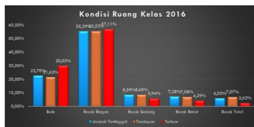
Grafik 4.1. Kondisi Ruang Kelas Daerah 3T, Tahun 2016