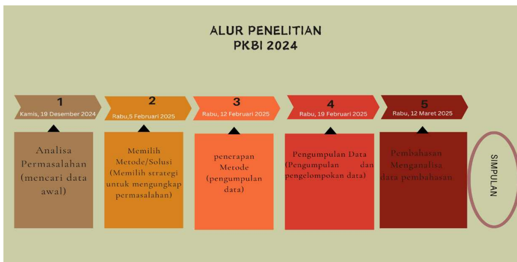
Gambar 2. Alur Penelitian

dengan model interaktif yang meliputi reduksi data, penyajian data, dan penarikan kesimpulan. Reduksi data dilakukan dengan menyeleksi informasi yang relevan dengan fokus penelitian, kemudian disajikan secara sistematis dalam bentuk narasi ringkas, dan diakhiri dengan penarikan kesimpulan untuk memperoleh gambaran komprehensif mengenai penerapan manajemen bimbingan prestasi religi di SD Negeri 3 Sidoharjo. Adapun alurnya sebagai berikut: