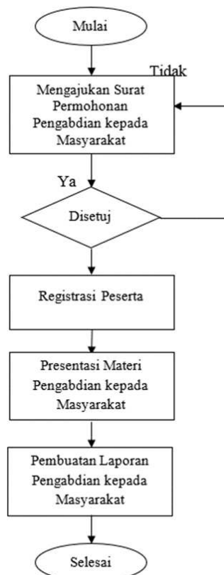
Gambar 2: Skema Pelaksanaan Kegiatan