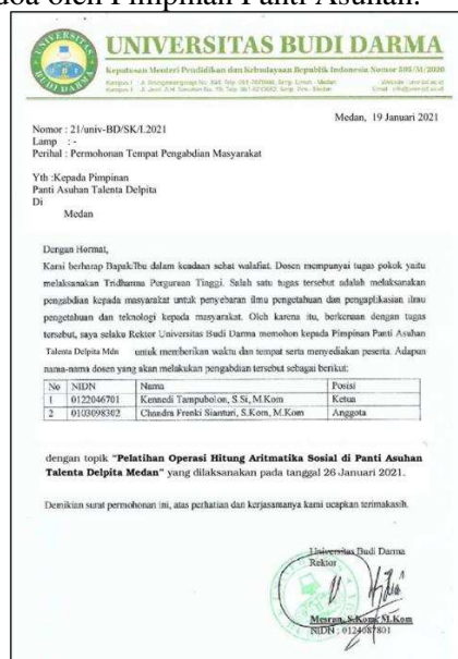
Gambar 3: Surat Permohonan dari Kampus