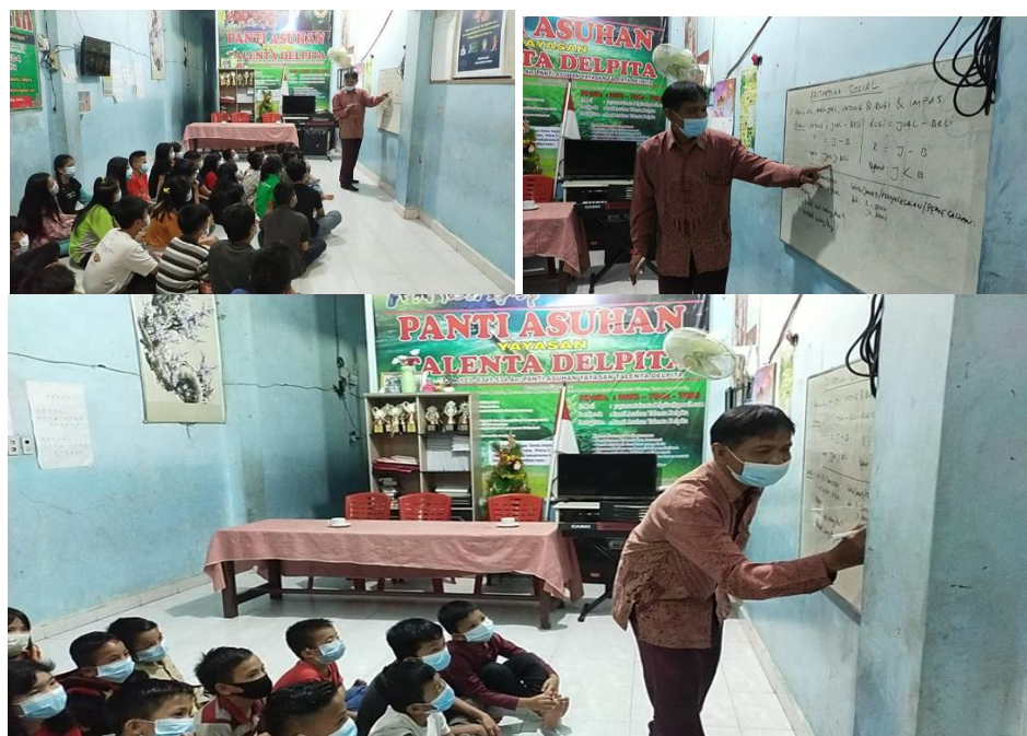
Gambar 5: Penjelasan Materi

Adapun beberapa soal latihan Standar dalam aritmatika sosial antara lain: