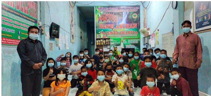
Gambar 6: Foto Bersama dengan anak-anak Panti Asuhan