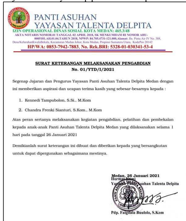
Gambar 8: Surat Keterangan Pelaksanaan Pengabdian dari Panti Asuhan