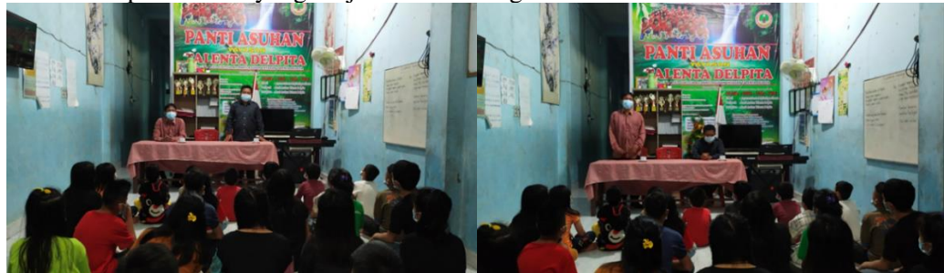
Gambar 4: Pembukaan dan Kata Sambutan Pelaksanaan Pengabdian

Peserta latihan pada kegiatan Pengabdian Kepada Masyarakat ini adalah anak-anak yang di asuh oleh Panti Asuhan Talenta Delpita Medan yang berjumlah 30 orang anak.