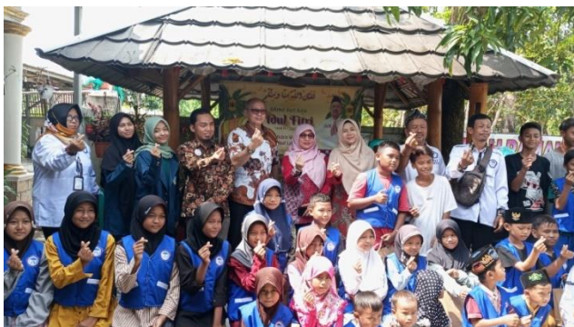
Gambar 7. Kegiatan Evaluasi dan Penutupan Edukasi Pencegahan Stunting

Dalam proses pemberian informasi kesehatan, anak-anak akan mengetahui hal-hal positif dan negatif yang pernah dilihat dan dilakukannya dalam kehidupan sehari-hari. Anak-anak juga mengakui kadang-kadang masih mengkonsumsi makanan yang kurang sehat dan berisiko mengalami diare yang akan menghambat pertumbuhannya. Dengan karakteristik pedesaan, anak-anak yang memiliki kegemaran bermain tanah, juga mengetahui bahwa menerapkan perilaku hidup bersih dan sehat seperti mencuci tangan setelah bermain di sawah atau bermain bersama dengan teman-teman lainnya perlu dilakukan agar tidak terjangkit penyakit infeksi parasit yang dapat berakibat pada sistem pencernaannya. Baunsele et al. (2023) juga menegaskan bahwa sosialisasi tentang penerapan perilaku hidup bersih dan sehat perlu ditekankan untuk mencegah terjadinya stunting pada anak.