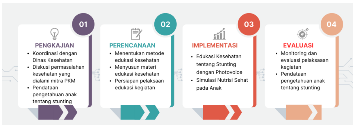
Gambar 1. Metode Pelaksanaan Edukasi Kesehatan tentang Pencegahan Stunting

Dalam pelaksanaan kegiatan edukasi kesehatan tentang pencegahan stunting pada anak, dilakukan dari tahap awal pendataan terlebih dahulu kemudian dilanjutkan perencanaan, implementasi dan terakhir tahap evaluasi. Pada tahap Pengkajian, tim pengabdian kepada masyarakat melakukan koordinasi dengan Dinas Kesehatan Kabupaten Indramayu untuk mengetahui prevalensi dan permasalahan stunting di Kabupaten Indramayu. Selain itu, koordinasi juga dilakukan dengan Ketua Panti Saung Sahabat Anak Indramayu terkait dengan kondisi masyarakat di sekitar Desa Temiang Kecamatan Kroya Kabupaten Indramayu. Selanjutnya dilakukan pengukuran tingkat pengetahuan anak-anak Panti Saung Sahabat Anak tentang Pencegahan Stunting.