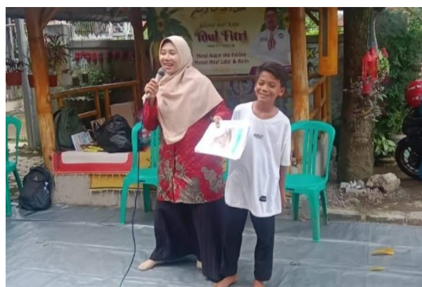
Gambar 6. Keseruan Ketika Edukasi Kesehatan Stunting dengan Metode Photovoice

Anak usia sekolah memiliki kesesuaian dengan penggunaan metode photovoice sebagai salah satu metode yang digunakan dalam edukasi kesehatan. Hal tersebut dikarenakan dengan menggunakan metode photovoice , anak-anak memiliki stimulasi untuk menyimak materi dari titik fokus pandangannya yang dipusatkan pada gambar. Herrick, Lawson & Matewos (2022) juga menegaskan bahwa melalui pandangan matanya, anak-anak mampu mengeksplorasi dan meningkatkan pengetahuannya.