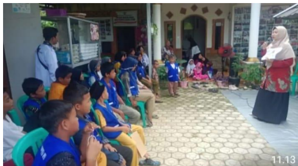
Gambar 5. Proses Pemberian Edukasi Kesehatan dengan Metode Photovoice

Pemberian edukasi kesehatan pada anak sangat diperlukan agar meningkatkan informasi kepada anak tentang salah satu pola hidup bersih dan sehat yaitu mengonsumsi makanan yang sehat. Melalui tujuan tersebut, anak-anak belajar mengidentifikasi apa saja yang dimaksud makanan yang bergizi dengan kandungan gizinya dan alasan mengapa suatu makanan dikatakan kurang baik untuk kesehatannya. Dengan metode photovoice , Pemateri menggunakan gambar untuk menstimulasi anak-anak dengan keingintahuan yang tinggi, untuk mengetahui makanan yang mengandung nilai gizi pada makanan yang ada di sekitarnya dengan harga yang terjangkau. Selain itu, anak-anak juga mampu mengidentifikasi makanan yang tidak baik untuk kesehatannya walaupun mereka sangat menyukainya. Namun, melalui gambar, anak-anak menyampaikan alasan mengapa suatu makanan menjadi tidak bergizi karena memiliki kandungan zat kimia yang tinggi yang dapat dilihat dari warna dan zat pengawet pada makanan.