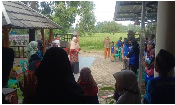
Gambar 4. Pembukaan Kegiatan Edukasi Kesehatan Pencegahan Stunting

Pemberian edukasi kesehatan pada anak sangat diperlukan agar meningkatkan informasi kepada anak tentang salah satu pola hidup bersih dan sehat yaitu mengonsumsi makanan yang sehat. Melalui tujuan tersebut, anak-anak belajar mengidentifikasi apa saja yang dimaksud makanan yang bergizi dengan kandungan gizinya dan alasan mengapa suatu makanan dikatakan kurang baik untuk kesehatannya. Dengan metode photovoice , Pemateri menggunakan gambar untuk menstimulasi anak-anak dengan keingintahuan yang tinggi, untuk mengetahui makanan yang mengandung nilai gizi pada makanan yang ada di sekitarnya dengan harga yang terjangkau. Selain itu, anak-anak juga mampu mengidentifikasi makanan yang tidak baik untuk kesehatannya walaupun mereka sangat menyukainya. Namun, melalui gambar, anak-anak menyampaikan alasan mengapa suatu makanan menjadi tidak bergizi karena memiliki kandungan zat kimia yang tinggi yang dapat dilihat dari warna dan zat pengawet pada makanan.