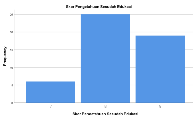
Gambar 8. Diagram Skor Pengetahuan Anak tentang Stunting Sesudah Diberikan Edukasi Kesehatan Pencegahan Stunting

Kegiatan edukasi kesehatan pencegahan stunting diakhiri dengan simulasi nutrisi sehat pada anak-anak. Anak-anak diberikan pengetahuan tentang makanan sehat yang sebaiknya dikonsumsi dan diberikan satu paket makanan sehat. Simulasi makanan yang sehat pada anak-anak diperlukan untuk memberikan pengetahuan pada anak-anak apa saja nilai gizi yang seharusnya dikonsumsi oleh anak-anak, diantaranya karbohidrat, protein, lemak, vitamin dan mineral. Manita, Akbar, Rahman, Rosanti & Rahayu (2022) juga menggunakan metode simulasi untuk penyusunan menu yang sehat dalam upaya pencegahan stunting. Kegiatan simulasi tersebut sebagai kegiatan praktek yang dilakukan untuk mendukung peningkatan pengetahuan pada peserta edukasi kesehatan bahwa perbaikan pola makan yang sehat dapat mencegah terjadinya stunting pada anak.