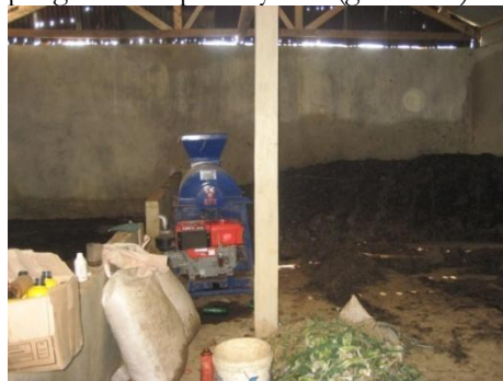
Gambar 1. Mesin Pengolah Sampah Sayuran Kelompok Tani Agro Segar

Sampah bila dibiarkan menumpuk tentu akan menjadi masalah, namun hal tersebut tidak terjadi pada anggota Kelompok Tani Agro Segar karena mereka mengumpulkan sampah sayuran setiap harinya di tempat khusus yang dikenal dengan rumah kompos, yaitu bangunan milik Kelompok Tani Agro Segar yang dilengkapi mesin-mesin pengolah sampah sayuran (gambar 1).