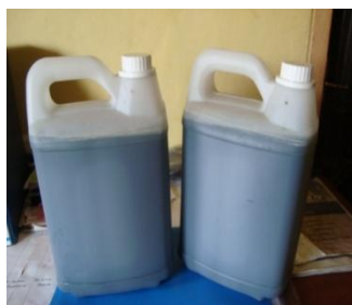
Gambar 3. Hasil Pembuatan Pupuk Bokhasi yang Sudah Dikemas