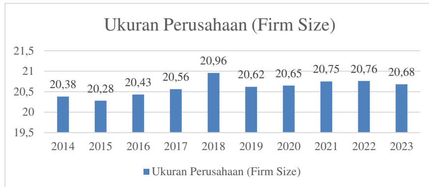
Gambar 3 Grafik Perkembangan Ukuran Perusahaan diproksikan menggunakan LN dari Total Aset PT Merck Tbk Periode 2014-2023

Sumber: Laporan Keuangan PT Merck Tbk Periode 2014-2023, data diolah (2025)