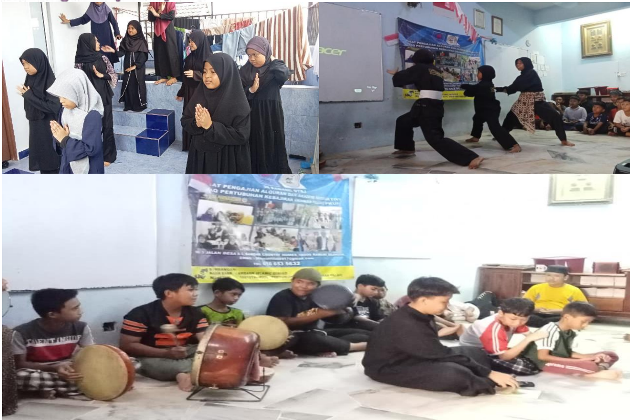
Gambar 2 Memperkenalkan kebudayaan Indonesia melalui tarian tradisional, bela diri silat dan musik tradisional kompang

Setelah konsep Merdeka Belajar mulai diterapkan dalam proses pembelajaran, perubahan yang terlihat bukan hanya pada cara siswa belajar. Siswa memang diberikan ruang yang lebih luas untuk aktif dalam kegiatan belajar, tetapi pada saat yang sama mereka juga mulai didorong untuk mengekspresikan kemampuan dan kreativitas yang dimiliki. Dari sini kemudian muncul gagasan tentang Merdeka Berkarya. Jika Merdeka Belajar memberi kebebasan dalam proses belajar, maka Merdeka Berkarya dapat dipahami sebagai kesempatan bagi siswa untuk menghasilkan sesuatu dari proses belajar tersebut, baik berupa ide, karya, maupun bentuk kreativitas lainnya.