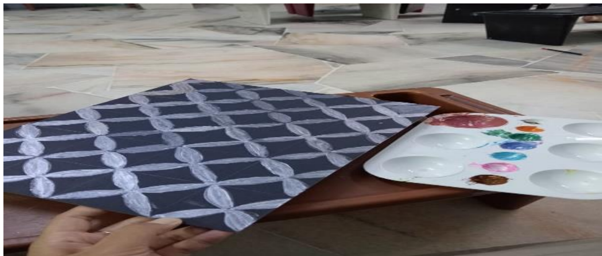
Gambar 4 Pengenalan budaya Nusantara dengan membuat gambar batik