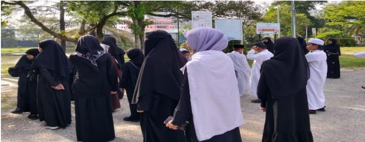
Gambar 1 optimalisasi pembelajaran di lingkungan terbuka

Berdasarkan dari temuan observasi dan wawancara yang telah dilakukan di Sekolah Indonesia Kuala Lumpur (SIKL), dapat dilihat bahwa keberadaan sekolah ini tidak hanya sebatas sebagai tempat belajar bagi Warga Negara Indonesia yang tinggal di Malaysia. Lebih dari itu, sekolah ini juga berperan krusial dalam menanamkan nilai-nilai kebangsaan kepada para siswa. SIKL menjadi salah satu sarana untuk memperkenalkan kembali budaya Indonesia kepada anak-anak yang berkembang di lingkungannya di luar negeri. Lingkungan sekolah sengaja dirancang agar seperti lingkungan sekolah yang ada di Indonesia. Hal ini dimaksudkan agar para siswa tetap merasakan nuansa pendidikan nasional meskipun mereka berada jauh dari tanah air. Selain kegiatan belajar di kelas, sekolah juga sering mengadakan berbagai aktivitas yang berkaitan dengan seni dan budaya Indonesia sebagai upaya menjaga identitas budaya bangsa di tengah lingkungan internasional.