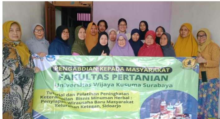
Gambar 1: Fasilitator bersama Mitra Desa Ketegan

Kegiatan dilakukan diawali dengan pembukaan, dilanjutkan dengan pembacaan doa. Acara pertama dilakukan dengan pengenalan pentingnya sebuah bisnis rumah tangga dalam menyumbang ekonomi keluarga. Pada umumnya orang merasa pesimis untuk bisa berwirausaha, karena kurangnya dukungan keluarga dan merasa