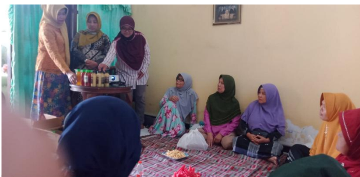
Gambar 2 : Tutorial Trik & Tip Berwirausaha

Jenis usaha baru pun harus disesuaikan di masa pandemi untuk bisa mencari pasar. Para warga masyarakatpun mulai memikirkan untuk mencari sumber pendapatan baru dengan membuat kegiatan