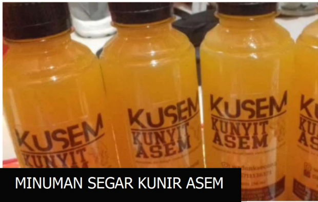
MINUMAN SEGAR KUNIR ASEM