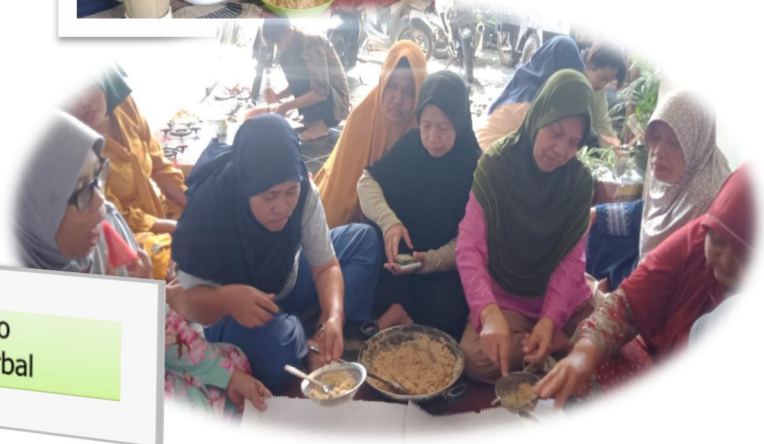
Gmbr 5 : Kegiatan Praktek / Demo membuat minuman Herbal