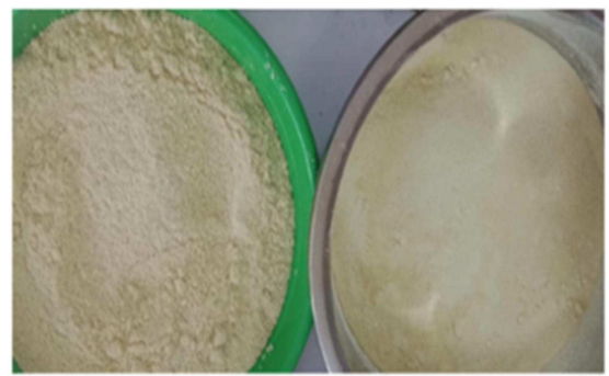
SERBUK INSTAN JAHE