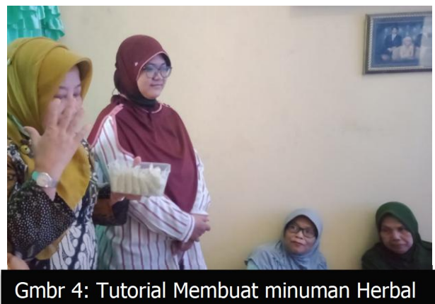
Gmbr 4: Tutorial Membuat minuman Herbal

Materi Selanjutnya mengenai cara pembuatan serbuk minuman jahe dilakukan oleh 4 mahasiswa semester 4 dan mhs semester 6.. dengan alat bantu ppt dan "video contoh pelaksanaan pembuatan serbuk instan jahe". Dari penyuluhan ini dikenalkan macam-macam jenis jahe yang bisa digunakan sebagai bahan, pembuatan serbuk instan jahe; diantaranya adalah Jahe gajah, jahe emprit, atau pun bisa pula jahe merah. Jahe mana yang lebih baik, tergantung selera konsumen dalam menikmati kesegaran minuman herbal instan jahe.