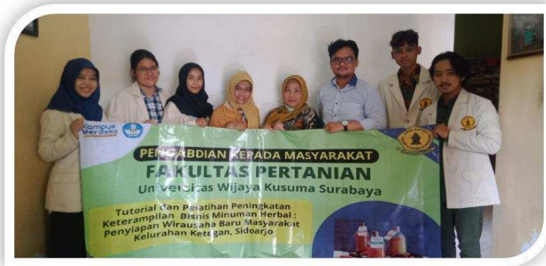
Gambar 6. Team Fasilitator ABDIMAS