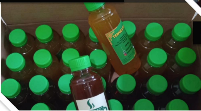
Gambar 7. Produk minuman Herbal