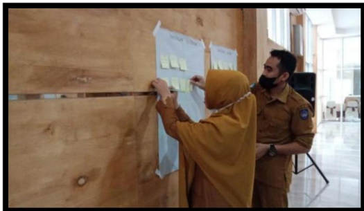
Gambar 6. Setiap Peserta Menempelkan Sticky Notes pada Kertas Plano Sesuai Tantangannya

Agenda selanjutnya adalah identifikasi tantangan dalam membangun budaya refleksi dimana pelatih ahli memberikan kepada setiap peserta kertas sticky notes dan meminta setiap peserta untuk menuliskan tantangan-tantangan yang pernah ditemui dalam membangun budaya refleksi. Kemudian pelatih ahli memfasilitasi peserta untuk mengkategorikan tantangan-tantangan yang sudah dituliskan peserta ke dalam tantangan eksternal maupun internal dan meminta peserta untuk menempelkan sticky notes tersebut kepada kertas plano yang sudah disediakan.