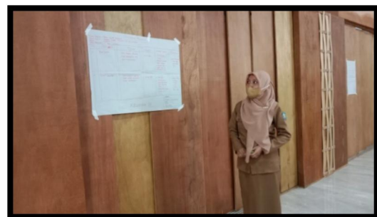
Gambar 5. Presentasi Hasil oleh Setiap Kelompok

Agenda selanjutnya adalah menyusun rencana moderasi sesi refleksi dimana aktivitas yang dilakukan adalah pelatih ahli mengelompokkan peserta lagi menjadi 4 kelompok yang beranggotakan 5 orang, kemudian peserta berdiskusi dalam kelompoknya mengenai bagaimana mengidentifikasi peserta, bagaimana mengidentifikasi tujuan refleksi, bagaimana mengidentifikasi waktu dan durasi, bagaimana menentukan metode yang digunakan dalam refleksi, bagaimana menyusun pertanyaan kunci refleksi dalam atmosfer yang positif kemudian peserta menuangkan hasil diskusinya pada kertas plano dan kertas flip chart dan setelah itu peserta mempresentasikan hasil diskusi kelompok dan memberikan umpan balik hasil diskusi.