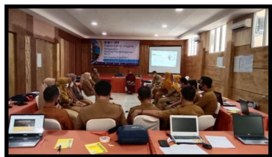
Gambar 8. Pelatih Ahli Memfasilitasi Peserta untuk Berbagi Cerita Hasil Refleksi Kegiatan yang Dilakukan

Agenda selanjutnya adalah refleksi komite pembelajaran pelatih ahli meminta peserta untuk menjawab pertanyaan dari tanyangan slide dimana berhubungan dengan pembelajaran yang didapatkan dan nantinya apa yang akan dilakukan kedepannya dalam pembelajaran terkait materi merancang dan memandu refleksi. Kemudian pelatih ahli memberikan kesempatan kepada 3 peserta perwakilan unsur guru, unsur kepala sekolah, dan unsur pengawas sekolah untuk berbagi hasil refleksi sesi hari ini.