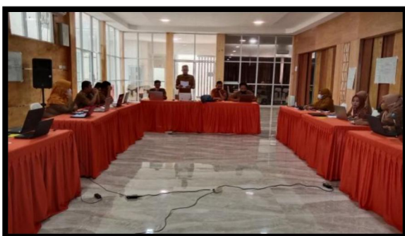
Gambar 7. Perwakilan Peserta Setiap Kelompok Mempresentasikan Hasil Diskusinya Masing-masing

Agenda selanjutnya adalah merumuskan solusi alternatif dari tantangan yang sudah diidentifikasi dimana pelatih ahli mengelompoknya peserta ke dalam 3 kelompok besar dan peserta berdiskusi dan berkolaborasi mencari solusi alternatif untuk mengatasi tantangan-tantangan yang telah diidentifikasi di agenda sebelumnya. Selanjutnya setiap perwakilan mempresentasikan hasil diskusi kelompoknya