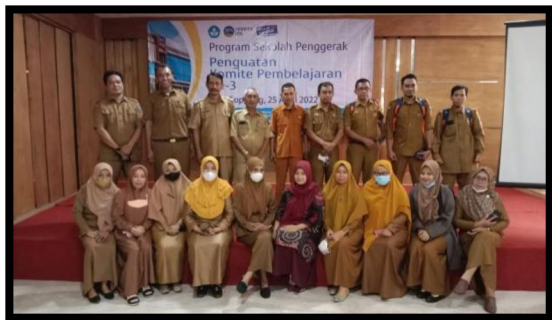
Gambar 9. Pelatih Ahli Foto Bersama dengan Peserta Kegiatan Pendampingan Penguatan Komite Pembelajaran

Tak lupa kegiatan ditutup dengan foto bersama peserta kegiatan.