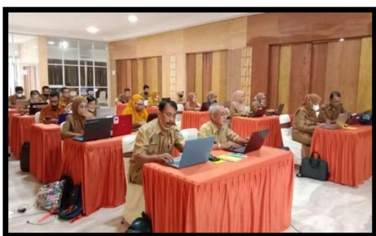
Gambar 3. Peserta Pendampingan Komite Pembelajaran Mengerjakan Lembar Kerja Reflektif

Agenda selanjutnya setelah pembukaan adalah pembelajaran mandiri terbimbing: belajar dari pengalaman dimana peserta melakukan aktivitas yaitu menjawab pertanyaan reflektif dalam lembar kerja (LK1) selanjutnya membaca ringkasan materi yang telah dibagikan oleh pelatih ahli dalam google drive yang materinya mengenai jurnal refleksi diri dan peningkatan profesionalisme guru dan setelah itu mengerjakan kembali pertanyaan reflektif pada lembar kerja 2 (LK2).