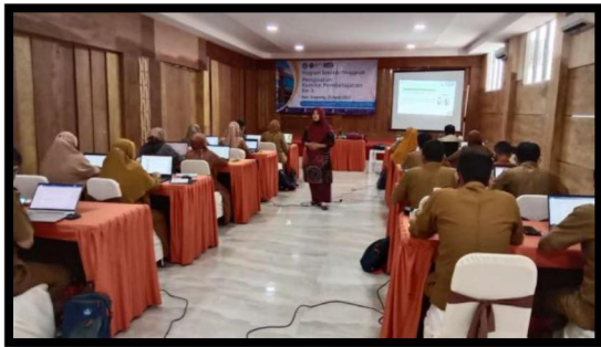
Gambar 2. Sesi Perkenalan dan Pembukaan Kegiatan oleh Pelatih Ahli

Pada agenda awal kegiatan yaitu pembukaan, aktivitas yang dilakukan peserta yaitu pembukaan dilanjutkan berdoa bersama setelah itu perkenalan pelatih ahli, ice breaking , penyampaian tujuan penguatan komite pembelajaran, dan membuat kesepakatan kelas untuk kegiatan ini.