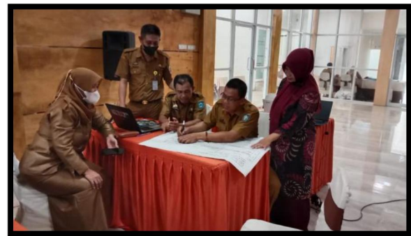
Gambar 4. Pelatih Ahli Mengamati Kelompok Berdiskusi Sesuai dengan Topik yang Dibahas Dalam Kelompoknya Masing-masing

sebelumnya pada pembelajaran materi terbimbing dan yang dibahas dikelompok masing-masing mengenai 4 topik yaitu topik fasilitasi yang efektif dan reflektif, topik tips persiapan memandu refleksi, topik metode refleksi, dan topik tips menyusun pertanyaan kunci refleksi dalam atmosfer yang positif kemudian peserta menuangkan hasil diskusinya pada kertas plano dan kertas flip chart dan setelah itu peserta mempresentasikan hasil diskusi kelompoknya dan memberikan umpan balik hasil diskusi.