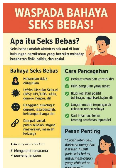
Gambar 1. Leaflet Edukasi