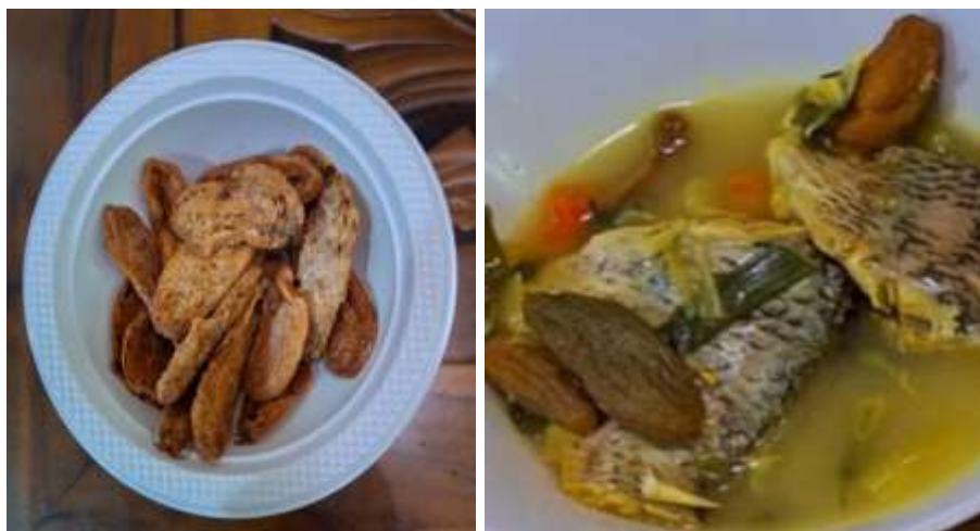
Gambar 5. Asam Sunti Dan Pindang Ikan Gurame Dengan Asam Sunti

Ibu-ibu PKK juga belum pernah membuat asam sunti yang merupakan buah belimbing yang difermentasikan dan dikeringkan. Asam sunti ini awet bertahun-tahun apabila disimpan dengan baik dan benar. Penggunaan buah belimbing wuluh sering digunakan sebagai tambahan masakan pindang dengan menggunakan buah segar. Pengembangan pemanfaatan buah belimbing wuluh perlu dioptimalkan sebaik mungkin. Hasil jawaban dari pre-test tentang asal asam sunti. Ada 11 peserta yang salah menjawabnya. Asam sunti berasal dari Lampung, 19 peserta menjawab dengan benar yaitu asam sunti berasal dari Aceh. Walau memiliki manfaat yang baik, namun untuk mengkonsumsi harus diperhatikan dengan baik. Adanya kandungan asam oksalat yang ada pada buah belimbing yang segar dan asam sunti. Maka orang yang bermasalah dengan kesehatan ginjal, sebaiknya harus membatasi makan buah belimbing wuluh. Menurut Anggreani dan Diyusmie (2025), buah belimbing memiliki asam oksalat yang bila dikonsumsi berlebihan dapat membahayakan fungsi ginjal. Menurut Suryani (2024), asam Sunti memiliki kandungan asam oksalat yang cukup tinggi. Kadar asam oksalat dalam asam sunti yang tidak mengalami perebusan lebih tinggi dibandingkan dengan kadar asam oksalat dalam asam sunti yang mengalami perebusan.