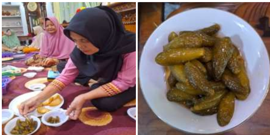
Gambar 4. Peserta Pengabdian Sedang Mencoba Raa Manisan Buah Belimbing Wuluh

Ibu-ibu PKK juga belum pernah membuat asam sunti yang merupakan buah belimbing yang difermentasikan dan dikeringkan. Asam sunti ini awet bertahun-tahun apabila disimpan dengan baik dan benar. Penggunaan buah belimbing wuluh sering digunakan sebagai tambahan masakan pindang dengan menggunakan buah segar. Pengembangan pemanfaatan buah belimbing wuluh perlu dioptimalkan sebaik mungkin. Hasil jawaban dari pre-test tentang asal asam sunti. Ada 11 peserta yang salah menjawabnya. Asam sunti berasal dari Lampung, 19 peserta menjawab dengan benar yaitu asam sunti berasal dari Aceh. Walau memiliki manfaat yang baik, namun untuk mengkonsumsi harus diperhatikan dengan baik. Adanya kandungan asam oksalat yang ada pada buah belimbing yang segar dan asam sunti. Maka orang yang bermasalah dengan kesehatan ginjal, sebaiknya harus membatasi makan buah belimbing wuluh. Menurut Anggreani dan Diyusmie (2025), buah belimbing memiliki asam oksalat yang bila dikonsumsi berlebihan dapat membahayakan fungsi ginjal. Menurut Suryani (2024), asam Sunti memiliki kandungan asam oksalat yang cukup tinggi. Kadar asam oksalat dalam asam sunti yang tidak mengalami perebusan lebih tinggi dibandingkan dengan kadar asam oksalat dalam asam sunti yang mengalami perebusan.