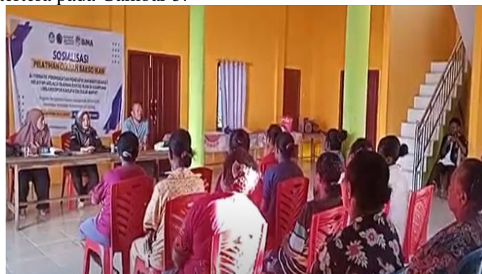
Gambar 5 Kegiatan sosialisasi

Berdasarkan hasil evaluasi terhadap peserta pelatihan melalui kuesioner diperoleh hasil bahwa kegiatan pengabdian ini meningkatkan pengetahuan ibu-ibu kampung Urbinasopen. Dimana hasil evaluasi ini menggambarkan 80 % dari peserta mengerti dan dapat memahami proses pembuatan bakso ikan. Sehingga diharapkan masyarakat dapat meneruskan kegiatan ini sehingga tujuan pelatihan ini membawa dampak yang nyata bagi kampung Urbinasopen. Berikut dokumentasi kegiatan sosialisasi tertera pada Gambar 5.