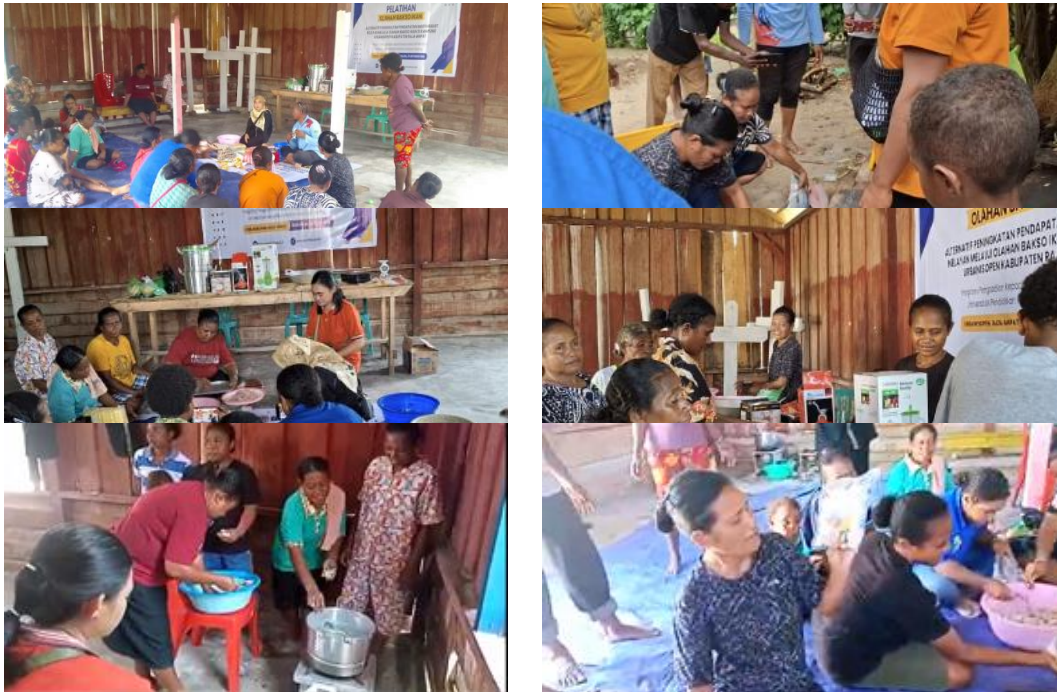
Gambar 4 Pelatihan pembuatan bakso ikan

pembangunan berkelanjutan kelima yaitu kesetaraan gender. Pelatihan pembuatan bakso tertera pada Gambar 4.