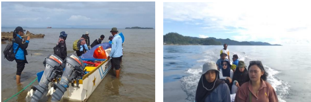
Gambar 2 Perjalanan ke Urbinasopen

Berikut dokumentasi perjalanan ke Urbinasopen tertera pada Gambar 2.