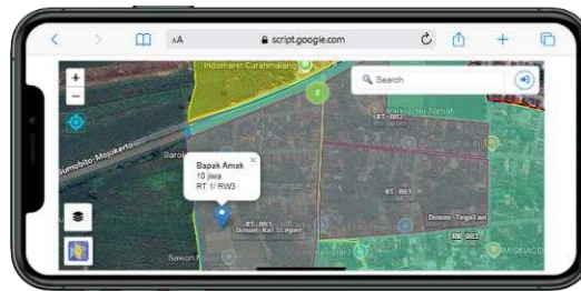
Gambar 1. Tampilan Pin Kepala Keluarga

Pengolahan data menghasilkan peta digital interaktif yang menampilkan batas RT/RW serta titik lokasi rumah warga dengan label nama kepala keluarga. Peta ini dibangun menggunakan platform Leaflet.js dan dapat diakses melalui komputer maupun smartphone . Di sisi lain, tim juga menyusun basis data kepala keluarga dalam bentuk Google Spreadsheet yang memuat nama kepala keluarga, koordinat GPS rumah, alamat lengkap, dan atribut pendukung lainnya. Basis data ini dihubungkan secara langsung dengan peta digital sehingga pembaruan data dapat dilakukan secara dinamis dan transparan.