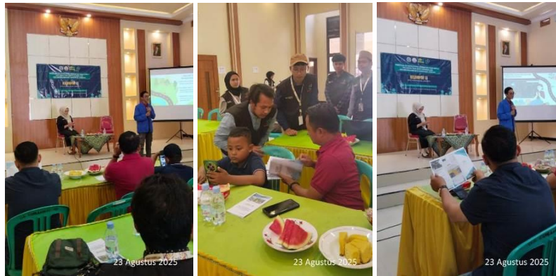
Gambar 3. Pelatihan dan Pendampingan Mitra

Produk yang dihasilkan program ini memiliki fungsi dan manfaat yang saling mendukung bagi pengurus RT/RW maupun perangkat desa. Peta digital wilayah RT/RW menyajikan batas wilayah dan lokasi rumah kepala keluarga secara interaktif sehingga memudahkan administrasi kependudukan, distribusi bantuan, perencanaan pembangunan, serta meminimalisasi potensi konflik batas wilayah. Basis data kepala keluarga berbasis Spreadsheet menjadi sumber informasi terintegrasi yang mempercepat pencarian dan pembaruan data serta mendukung pengambilan keputusan berbasis data. Panduan teknis yang disusun dalam bentuk manual admin, manual user, dan leaflet memudahkan pengurus RT/RW dalam mengelola sistem tanpa ketergantungan pada pihak luar. Pelatihan dan pendampingan mitra memberdayakan pengurus RT/RW agar mampu mengoperasikan, memperbaiki, dan memanfaatkan sistem secara berkelanjutan meskipun program KKN telah selesai..