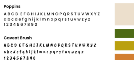
Gambar 1. Ilustrasi, font dan warna yang digunakan

Program kreatif adalah bagaimana pelaksanaan proses kreatif atau proses produksi, seperti proses pembuatan layout , finishing , dan desain final . Tahapan layouting terdiri dari tiga tahapan, yaitu, layout gagasan, layout kasar, layout lengkap (Sanyoto, 2006)