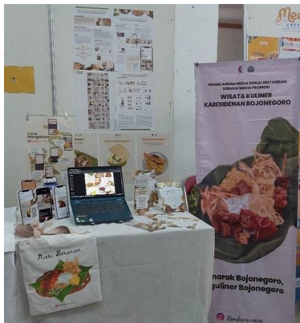
Gambar 6. Tampilan media pendukung dalam pameran karya

Terdapat media pendukung dan merchandise yang telah disebutkan sebelumnya, yang kemudian digunakan sebagai media presentasi di kegiatan pameran.