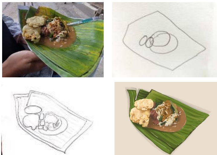
Gambar 2. Visualisasi rawon pecel; foto makanan rawon pecel, layout gagasan, layout kasar, layout lengkap.

Tahapan visualisasi menggunakan foto makanan dari hasil observasi sebagai acuan, layout gagasan dilakukan untuk memetakan tata letak tampilan kuliner secara manual. Layout kasar merupakan lanjutan dari layout gagasan, dilakukan penyempurnaan dan merapikan layout gagasan. Tahapan ini dapat dilakukan secara manual maupun digital. Dalam hal ini layout kasar dilakukan secara manual. Layout lengkap merupakan pembuatan desain final, dimana semua elemen sudah persis seperti bentuk jadinya. Layout lengkap dilakukan dengan aplikasi pendukung yaitu Procreate.