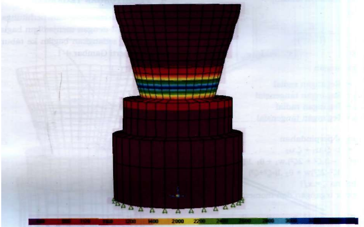
Gambar 4-3: Tegangan 3400 kg/cm 2 pengaruh temperatur RX 320