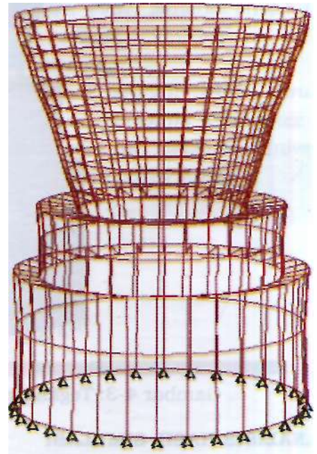
Gambar 4-1: Hasil permodelan metode elemen hingga

Untuk memudahkan perhitungan, model dibuat dengan menjadikan bagian exit bebas, sedangkan bagian ke tabung dijepit seperti Gambar 4-1.