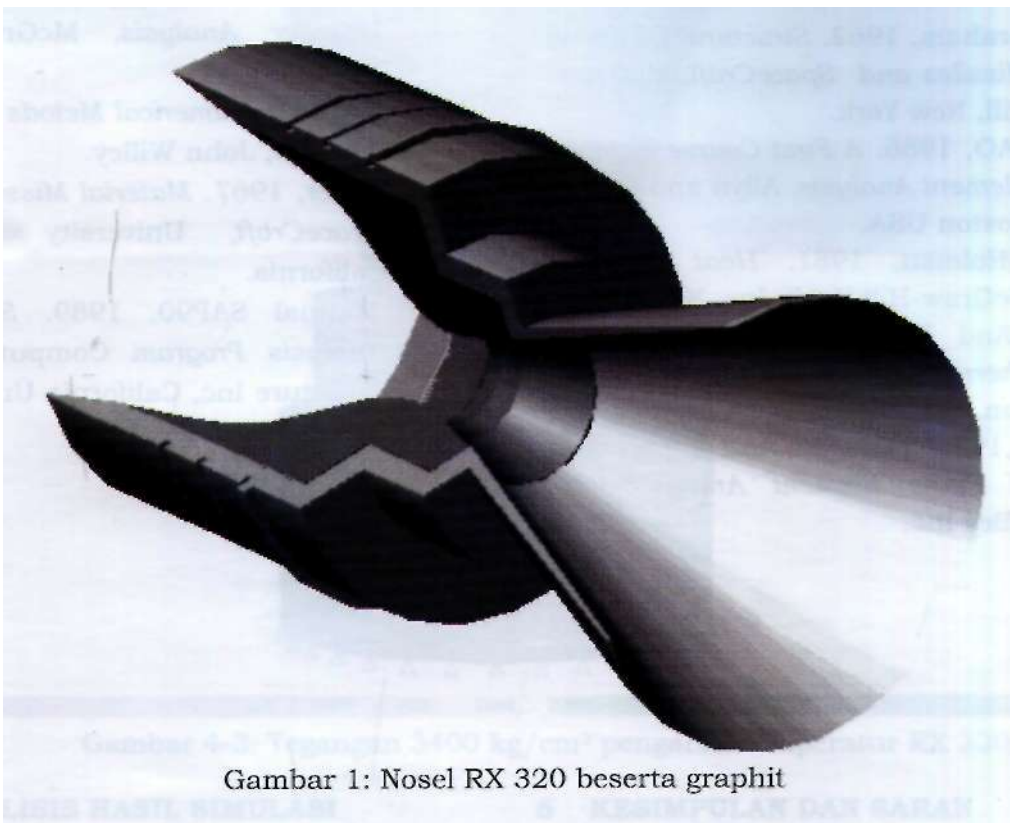
Gambar 1: Nosel RX 320 beserta graphit