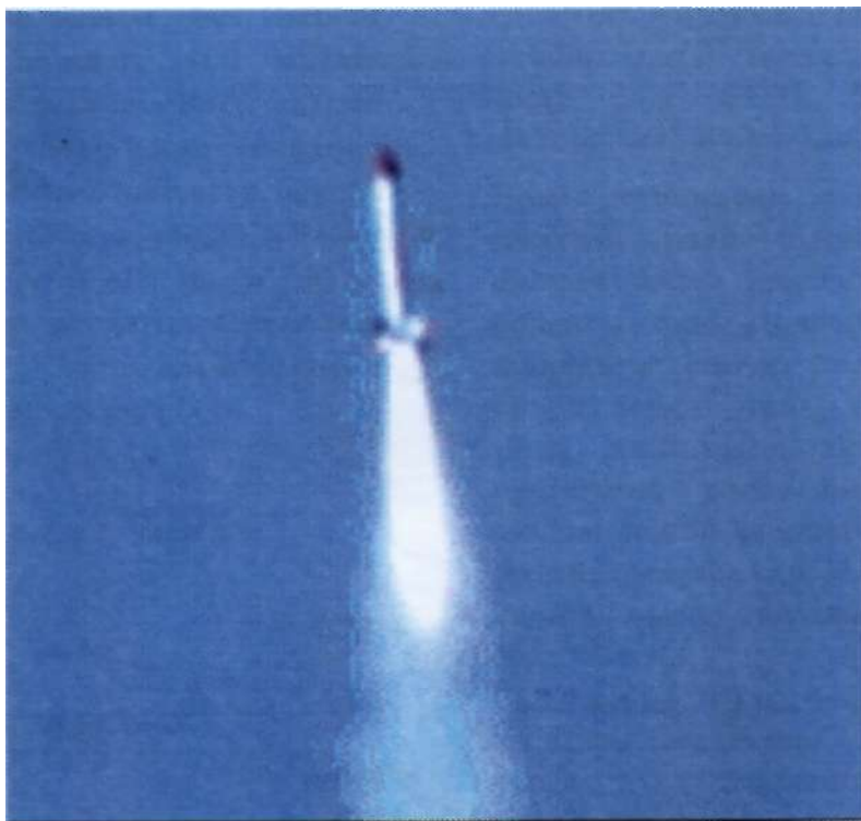
Gambar 2. Roket RX-320 pada uji terbang Mei dan Juli 2008