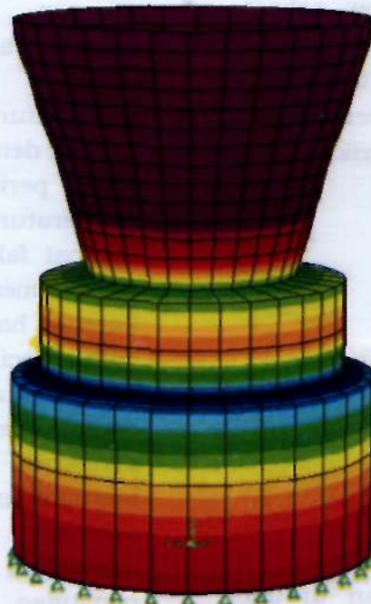
Gambar 4-2: Tegangan 1400 kg/cm 2 pengaruh tekanan RX 320