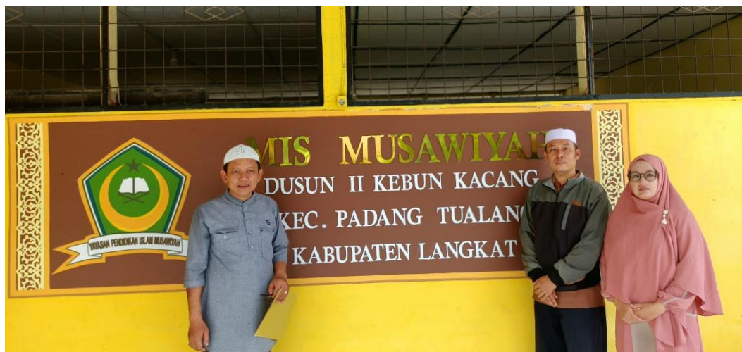
Gambar 2. Tampak Depan Ruang Kepala Sekolah

Pendidikan dasar memiliki peran penting dalam membentuk kualitas sumber daya manusia yang unggul. Namun, tuntutan dunia pendidikan pada era digital semakin meningkat seiring perkembangan teknologi informasi dan komunikasi. Darmawan (2019:33) menyatakan bahwa “tantangan pendidikan modern menuntut guru mampu mengintegrasikan teknologi sebagai bagian dari proses belajar-mengajar.” Hal ini menyebabkan lembaga pendidikan, termasuk madrasah, harus mampu beradaptasi agar pembelajaran tetap relevan dengan perkembangan zaman.