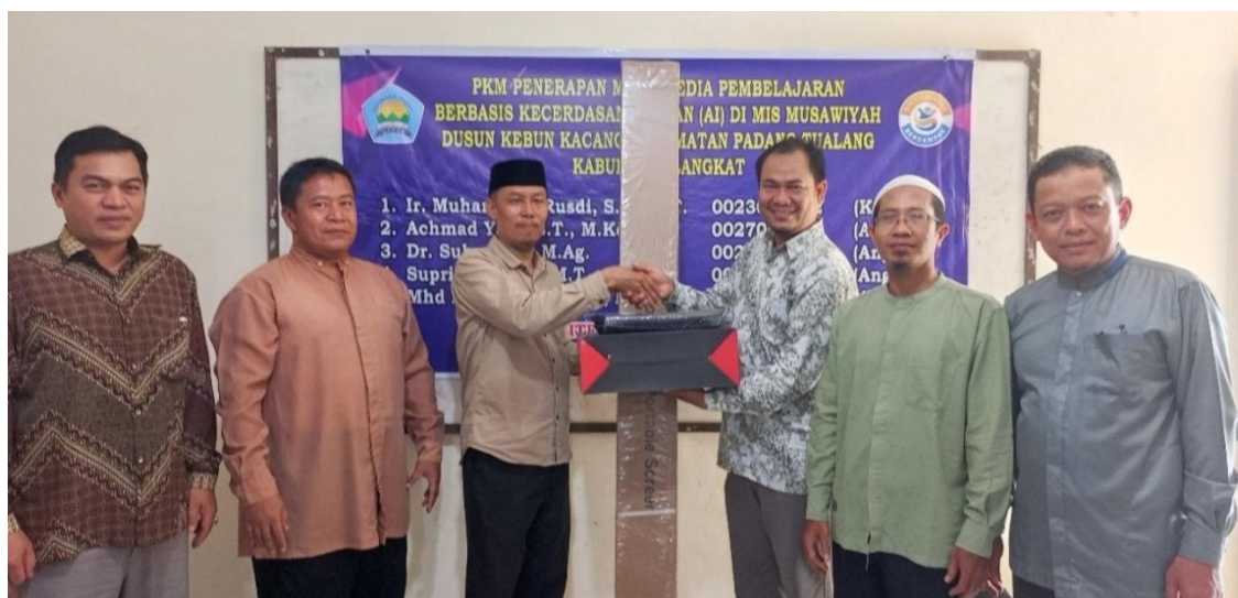
Gambar 4. Serah terima barang bantuan dari ketua tim ke kepala madrasah

Kegiatan PKM ini berhasil meningkatkan kemampuan guru dalam penggunaan teknologi pembelajaran digital. Sebelum kegiatan, sebagian besar guru hanya menggunakan metode konvensional dengan media papan tulis dan buku teks. Setelah kegiatan, seluruh guru mampu membuat dan menerapkan media ajar berbasis multimedia dan AI. Selain peningkatan keterampilan, madrasah juga memperoleh peningkatan sarana pembelajaran berupa bantuan perangkat proyektor yang kini dimanfaatkan dalam kegiatan belajar-mengajar. Guru menjadi lebih kreatif dan termotivasi untuk mengembangkan media ajar digital yang menarik bagi siswa. Perbandingan Kondisi Sebelum dan Sesudah Kegiatan PKM dapat dilihat pada tabel 3.