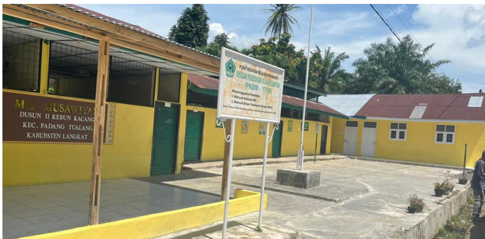
Gambar 1.1. Kondisi Sekolah MIS