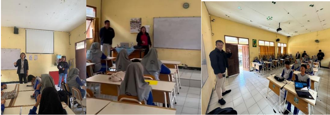
Gambar 1. Penyampaian materi tentang cyberbullying media sosial di SMK Negeri 1 Mojokerto

pencemaran nama baik, sebagaimana dijelaskan dalam pasal 27 ayat (3), dapat dikenakan pidana penjara maksimal selama 4 tahun dan denda hingga Rp 750.000.000,-