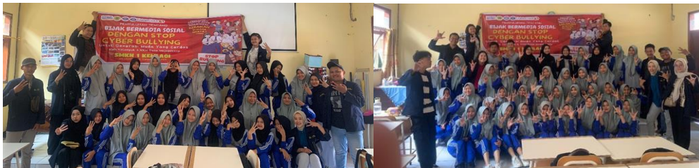
Gambar 3. Foto Bersama siswa SMK Negeri 1 Kemlagi