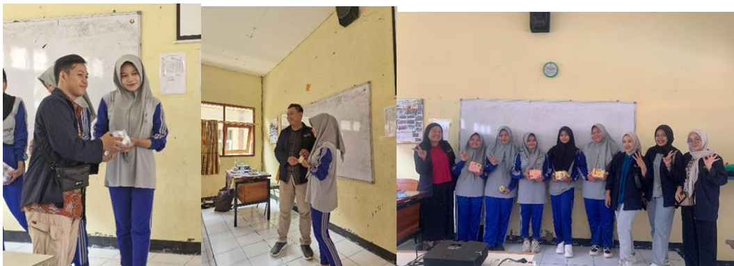
Gambar 2. Penyerahan hadiah bagi siswa yang mengajukan pertanyaan terbaik