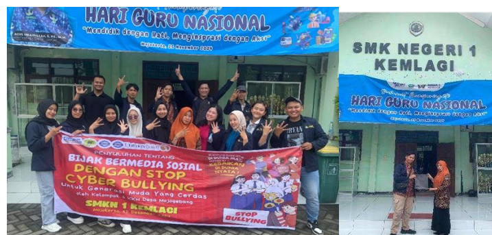
Gambar 4. Penyerahan cinderamata kepada SMK Negeri 1 Kemlagi