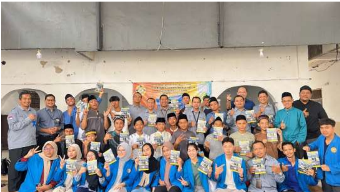
Gambar 4. Peserta Pengabdian Bersama Tim PKM Dosen Universitas Pamulang

Hasil dari kegiatan Pengabdian oleh dosen Prodi Manajemen Program Sarjana, Fakultas Ekonomi dan Bisnis Universitas Pamulang dapat membuahkan hasil yang positif terlihat dari antusias dan bersemangat dalam mengikuti pemberian materi, tanya jawab dan kuis. Berikut terlihat gambar peserta pengabdian santri di Yayasan Panti Asuhan Al-Munasharoh Tangerang Selatan Bersama Tim Pelaksana Pengabdian Dosen-dosen dan mahasiswa-mahasiswi Universitas Pamulang.