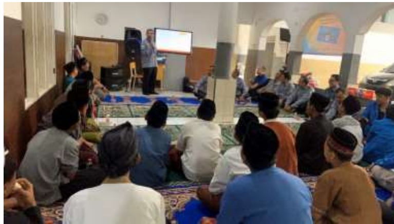
Gambar 2. Tim PKM Dosen Universitas Pamulang menyampaikan materi

Hasil dari penyuluhan dan pelatihan oleh dosen Manajemen Universitas Pamulang terhadap santri di Yayasan Panti Asuhan Al-Munasharoh Tangerang Selatan yang terlihat antusias dalam mendengarkan materi pengabdian yang disampaikan, seperti terlihat gambar terlampir