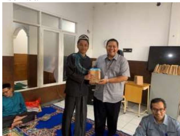
Gambar 3. Pemberian Hadiah kepada Peserta PKM

Adapun Hasil pengabdian masyarakat yang diperoleh adalah bertambahnya keilmuan santri di Yayasan Panti Asuhan Al-Munasharoh Tangerang Selatan, khususnya untuk menjadi wirausaha muda kreatif, yaitu yang mampu dalam menghadapi di era digitalisasi. Adapun kegiatan diskusi, tanya jawab dan pembagian hadiah kepada peserta yang aktif menjawab pertanyaan dalam kegiatan pengabdian, sebagaimana gambar berikut: