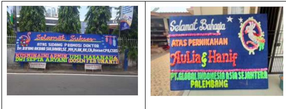
Gambar 2 : Dokumentasi Pengabdian