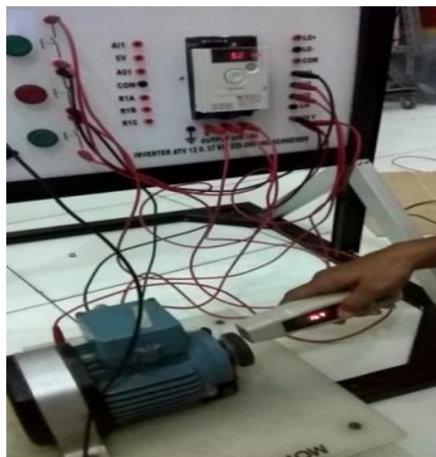
Gambar 3.1 Pengukuran Rpm untuk frekuensi 5 Hz