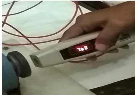
Gambar 3.2 Pengukuran Rpm motor frekuensi 25.Hz