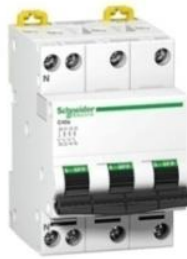
Gambar 2.3 (MCB 3 fasa)

MCB atau pemutus tenaga berfungsi untuk memutuskan suatu rangkaian apabila ada arus yang mengalir dalam rangkaian atau beban listrik yang melebihi kemampuan. Pemutus tenaga ini terdiri dari 2 jenis yaitu untuk sistem 1 fasa dan sistem 3 fasa [8]. MCB 3 fasaterdiri dari tiga buah pemutus tenaga 1 fasa yang disusun menjadi satu kesatuan. Pemutus tenaga mempunyai 2 posisi, saat menghubungkan maka antara terminal masukan dan terminal keluaran MCB pada kontak. Pada posisi saat MCB pada kedudukan (ON), dan ketika ada gangguan MCB dengan sendirinya akan melepas rangkaian secara otomatis kedudukan saklarnya (OFF), saat posisi terminal masukan dan keluaran MCB tidak menyambung [9]