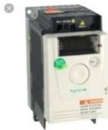
Gambar 2.1 Inverter

Pada umumnya variabel speed drive atau bisa disebut dengan inverter adalah peralatan yang digunakan untuk mengatur kecepatan putaran motor [4]. Penggunaan VSD bisa untuk mengaplikasikan motor AC maupun DC. Akan tetapi istilah (VSD) selalu digunakan untuk aplikasi motor AC [5]. Inverter menggunakan frekuensi tegangan masuk untuk mengatur kecepatan putaran motor. Jadi dengan memainkan perubahan frekuensi tegangan yang masuk pada motor, maka kecepatan putaran motor akan berubah. inverter biasa disebut variable speed drive [6]. Inverter atv12 ditunjukkan pada gambar