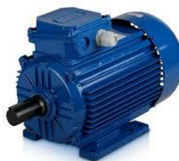
Gambar 2.2 (Motor 3 listrik fasa)

Motor listrik berfungsi untuk mengubah energi listrik menjadi energi mekanik yang berarti tenaga putar. Motor listrik terdiri dari dua bagian yang sangat penting yaitu stator atau bagian yang diam dan rotor atau bagian berputar. Pada motor AC, kumparan rotor tidak menerima energi listrik secara langsung, tetapi secara induksi seperti yang terjadi pada energi kumparan transformator. [7]