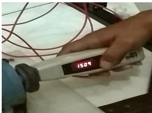
Gambar 3.3 Pengukuran Rpm motor frekuensi 50.Hz