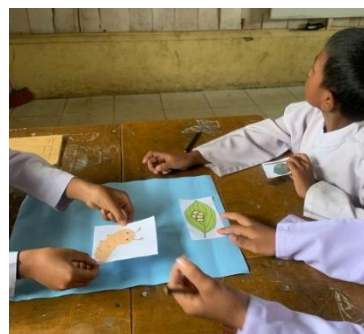
Gambar 1 Proses Pembelajaran pada Siklus I dan Siklus II

Kegiatan pembelajaran dengan menggunakan buku cerita bergambar edukatif cukup efektif dalam pelaksanaan proses pembelajaran di kelas III SDN 125/IX Simpang Selat. Hal ini terlihat dari adanya peningkatan aktivitas dan motivasi belajar siswa berdasarkan tabel di bawah ini: