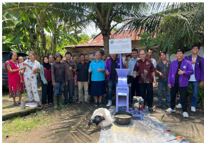
Gambar 9. Serah Terima Mesin Giling Tongkol Jagung Dengan Perwakilan Kelompok Peternak