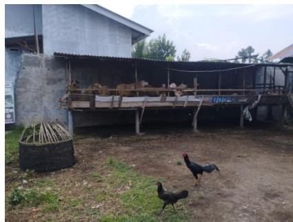
Gambar 2. Lokasi Kandang Mitra di Dusun VI Purwojoyo