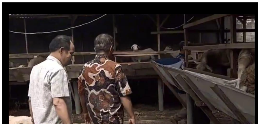
Gambar 3. Tim Melakukan Kunjungan Dan Meninjau Kandang Mitra