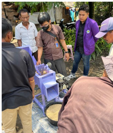
Gambar 8. Uji Coba Mesin Giling Tongkol Jagung Di Lokasi Mitra

Penggunaan mesin giling tongkol jagung ini menghasilkan luaran sebanyak 50 kg janggal (abu/bungkil) dengan kualitas yang cukup baik. Mitra cukup puas dengan kinerja mesin yang diserahterimakan dimana output (luaran) yang dihasilkan sesuai dengan harapan baik jumlah maupun kualitasnya.