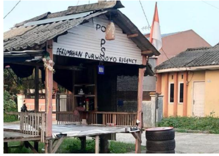
Gambar 1. Lokasi Dusun VI Purwojoyo, Desa Suka Maju, Kecamatan Sunggal