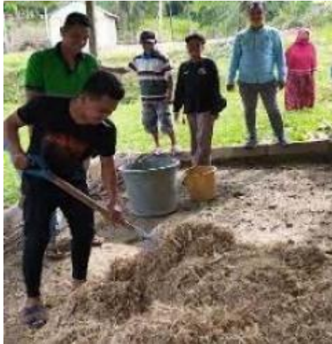
Gambar 5. Proses Pembuatan Janggel Jagung Secara Manual

Terkait dengan permasalahan yang dihadapi oleh kelompok peternak yang ada di Dusun VI Desa Suka Maju yang diuraikan di atas, maka hal ini menjadi salah satu tantangan yang harus diselesaikan yaitu terwujudnya suatu alat/ mesin untuk menggiling tongkol jagung menjadi janggel yang dapat membantu peternak untuk mendapatkan pakan alternatif untuk domba mereka.