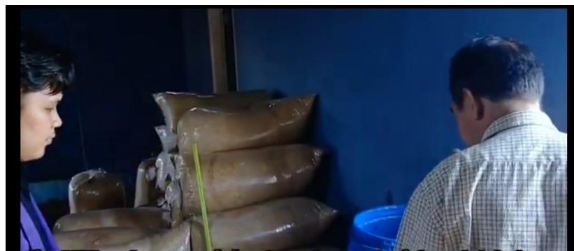
Gambar 4. Tim Meninjau Kondisi Jaggel Jagung Yang Dibeli Mitra