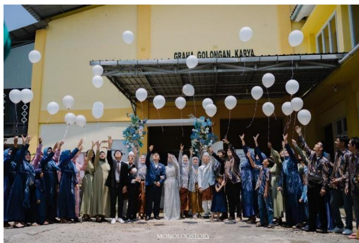
Gambar 04 Pelepasan balon dalam rangkaian acara pernikahan

Inovasi yang dilakukan para MUA di Pekalongan dewasa ini memadukan antara tekstual dan kontekstual, dimana unsur modern dalam sebuah acara pernikahan juga mengaitkan unsur-unsur yang berkaitan dengan kearifan lokal. Seperti halnya rangkaian acara pelepasan balon dalam acara pernikahan merupakan suatu bentuk pembaharuan yang tidak ditemukan pada acara pernikahan terdahulu di daerah Pekalongan. Walaupun kini banyak penambahan rangkaian acara di dalam pesta-pesta pernikahan seperti pelepasan balon, kirab saxophone, wedding kiss , flashmob , dsb, namun masyarakat Pekalongan tetap mengadakan rangkaian acara Tamplek Ponjen sesuai akad nikah dilangsungkan.