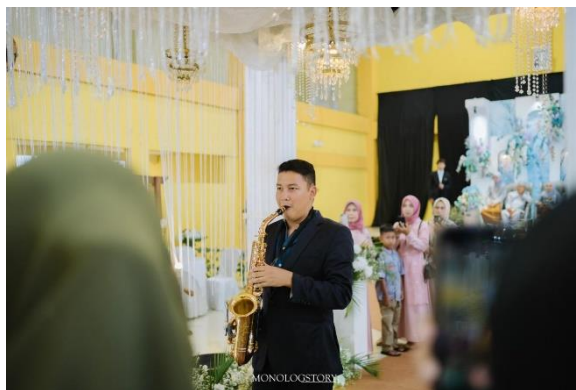
Gambar 05 Kirab Saxophone dalam rangkaian acara pernikahan