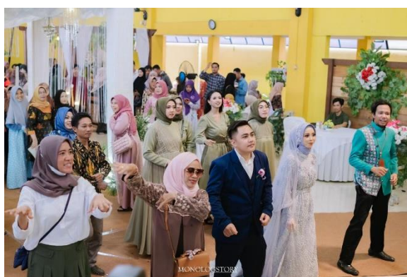
Gambar 06 Flashmob (menari bersama)

Iniilah yang membuat MUA di Pekalongan harus bersikap adaptif, mampu merangkai berbagai acara di pernikahan menjadi lebih kompleks, dengan memadukan unsur modern dan tradisional.