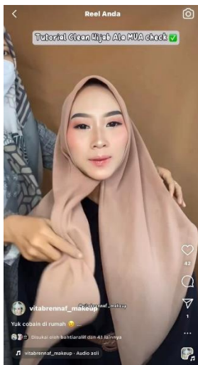
Gambar 01 Konten Tutorial Tips Kecantikan

Proses pembelajaran kini dapat dilakukan secara online, dengan menonton tutorial make up yang ada di internet. Para konten kreator yang rajin membagikan tutorial make up, dan tips-tips dalam dunia kecantikan tidak serta merta mereka lakukan secara cuma-cuma. Mereka akan mendapatkan feed back dari konten-konten yang dihasilkan, sehingga di era digital seperti sekarang ini banyak orang yang berlomba-lomba dalam mengunggah konten-konten seputar dunia kecantikan.