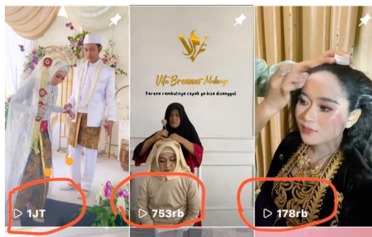
Gambar 02 Konten Make Up Viral (FYP)

Membuat konten merupakan hal yang diharuskan oleh para MUA guna bersaing secara sehat. Maka tak jarang pula MUA yang membuka lowongan kerja untuk membutuhkan konten kreator sosial media. Make Up Artist (MUA) yang tidak mempunyai keahlian dan waktu untuk membuat konten mensiasatinya dengan hal tersebut. Mereka rela mengalokasikan dana untuk membayar konten kreator. Hal ini bertujuan agar MUA tetap eksis, dapat mengikuti dinamika perkembangan zaman. Semakin eksis MUA, maka akan semakin mudah untuk dapat dikenal di masyarakat.