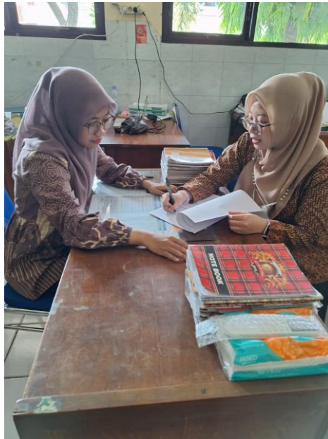
Gambar 1. Wawancara dengan Guru Mata Pelajaran

Tahap selanjutnya setelah dilakukan observasi dan wawancara ialah tahap pelatihan, pelatihan yang dilakukan ialah dalam pembuatan herbarium oleh peserta didik saat pembelajaran materi klasifikasi makhluk hidup di kelas. Tahapan awal yang harus dilakukan peserta didik ialah diarahkan untuk mencari tumbuhan yang akan dijadikan herbarium. Peserta didik mengambil bagian organ dari tumbuhan berupa daun yang selanjutnya akan dikoleksi menjadi herbarium. Berikut dokumentasi peserta didik yang mencari herbarium di lingkungan sekitar sekolah untuk dijadikan bahan herbarium.