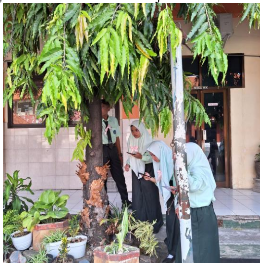
Gambar 2. Pencarian Bahan Herbarium di sekitar Lingkungan Sekolah

Tahap selanjutnya setelah dilakukan observasi dan wawancara ialah tahap pelatihan, pelatihan yang dilakukan ialah dalam pembuatan herbarium oleh peserta didik saat pembelajaran materi klasifikasi makhluk hidup di kelas. Tahapan awal yang harus dilakukan peserta didik ialah diarahkan untuk mencari tumbuhan yang akan dijadikan herbarium. Peserta didik mengambil bagian organ dari tumbuhan berupa daun yang selanjutnya akan dikoleksi menjadi herbarium. Berikut dokumentasi peserta didik yang mencari herbarium di lingkungan sekitar sekolah untuk dijadikan bahan herbarium.