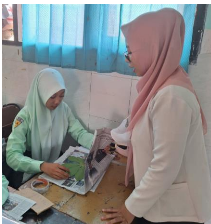
Gambar 3. Peserta didik dalam Kegiatan Pelatihan Herbarium

menggunakan fasilitas berupa hp ataupun laptop untuk mencari sumber. Peserta didik dibebaskan untuk mencari sumber dari berbagai macam bentuk, namun masih dalam pantauan guru, agar informasi yang didapatkan dapat valid. Berikut dokumentasi saat peserta didik melakukan kegiatan herbarium di dalam kelas.