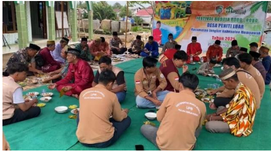
Gambar 8. Panitia Lomba Hut RI, Gotong Royong, Acara Robo-robo