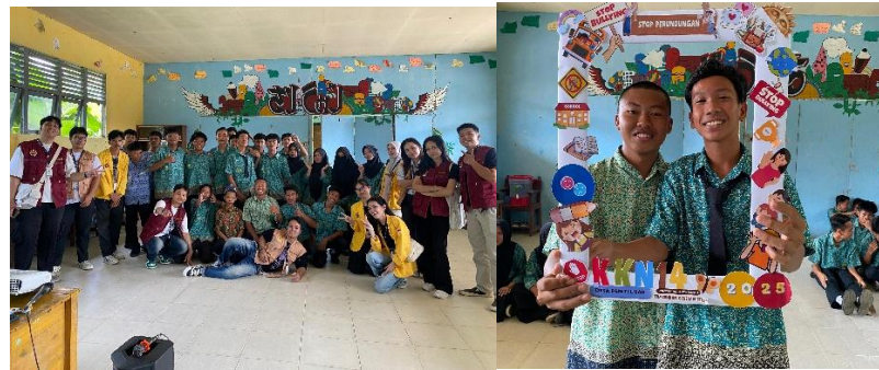
Gambar 2. Sosialisasi anti ke Bullying MTs dan MA Ar-Raudhatul Islamiya