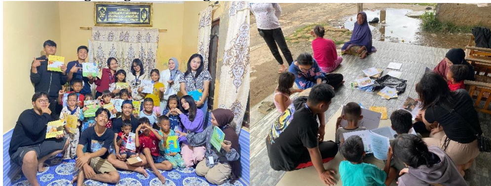
Gambar 3. Pojok Baca

Pojok baca yang dikembangkan di Desa Peniti Luar bertujuan untuk memperkenalkan kembali budaya membaca di kalangan anak-anak desa di tengah pesatnya perkembangan teknologi digital. Program Gerakan Literasi Sekolah Kemendikbud mengartikan kemampuan berliterasi sebagai kemampuan mengakses, memahami, dan menggunakan sesuatu secara cerdas melalui berbagai kegiatan, antara lain membaca.(3) Buku-buku bacaan yang beragam, mulai dari buku agama, cerita rakyat, hingga buku pengetahuan umum, disediakan dibagikan oleh anggota kelompok kepada anak-anak . Pojok Baca ini menjadi tempat favorit bagi lebih dari 50 anak-anak desa yang rutin mengunjungi untuk membaca dan mendiskusikan buku pilihan mereka. Program ini tidak hanya meningkatkan minat baca, tetapi juga melatih kemampuan mereka dalam berpikir kritis dan berdiskusi. Hal ini tercermin dari antusiasme anak-anak desa dalam mengikuti lomba menulis yang diadakan sebagai bagian dari kegiatan ini.