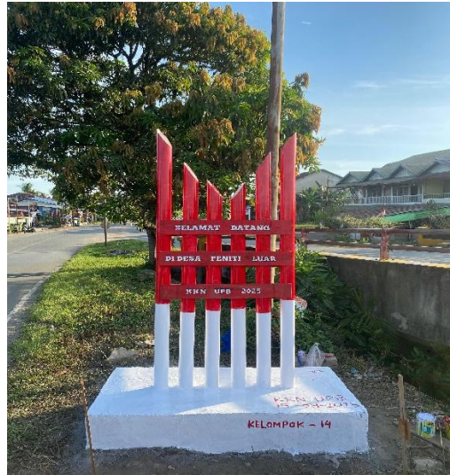
Gambar 7. Tugu Selamat Datang