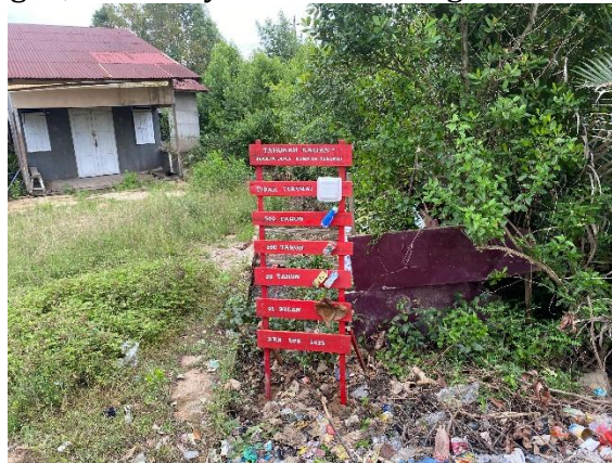
Gambar 4. Plang Edukasi Sampah

memilah sampah rumah tangga dan mengurangi kebiasaan membuang sampah sembarangan, khususnya di sekitar sungai.