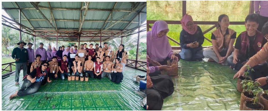
Gambar 5. Pelatihan pemanfaatan limbah sabut kelapa menjadi pot