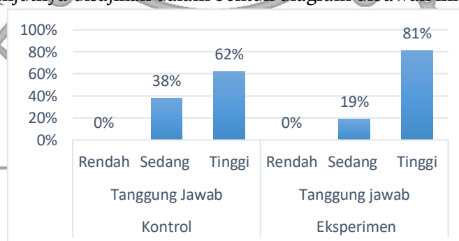
(Gambar 2. Diagram Hasil Kategori Indikator Tanggung Jawab)

Tabel 4. rerata tanggung jawab kelas eksperimen dikategori tinggi, sedangkan kelas kontrol reratanya dikategori sedang, sehingga rerata eksperimen lebih tinggi dibandingkan rerata kontrol. Selanjutnya disajikan dalam bentuk diagram dibawah ini.