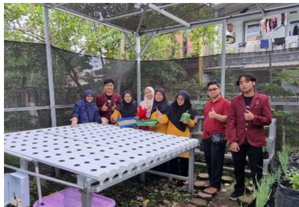
Gambar 2. Hidroponik yang diimplementasikan di lahan masyarakat sasaran