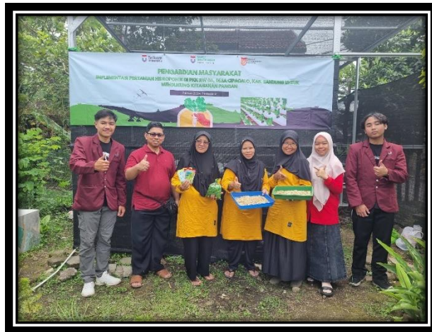
Gambar 1. Kegiatan pembibitan pada rokwool