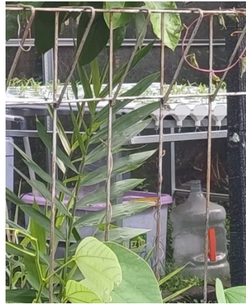
Gambar 3. Bibit yang ditanam mulai tumbuh