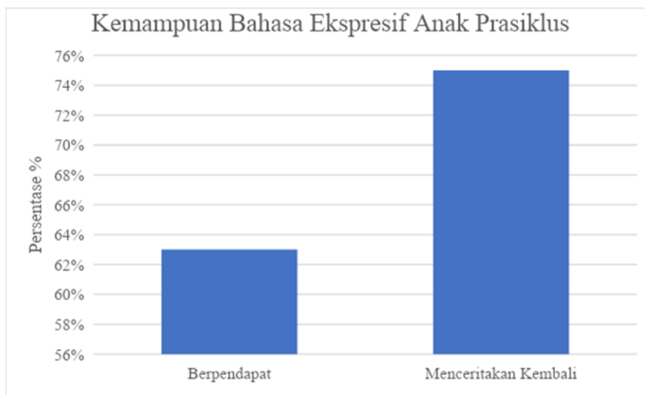
Gambar 1. Kemampuan Bahasa Ekspresif Anak Prasiklus

Menurut tabel di atas dapat disimpulkan bahwasanya kemampuan bahasa ekspresif anak di PAUD Al-Hassanah Samarinda berada pada kategori cukup dengan rata-rata 69 %.