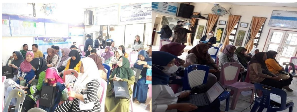
Gambar 3. Para peserta dengan tertib dan antusias mendengarkan pemaparan materi dan diskusi

Setelah itu, kami akan mempresentasikan materi dan melakukan kegiatan komunitas untuk bertanya. Para peserta sangat antusias. Hal ini juga terlihat dari pertanyaan-pertanyaan yang diajukan oleh para peserta karena mereka sangat termotivasi untuk memahami pinjaman online dan perdagangan digital.