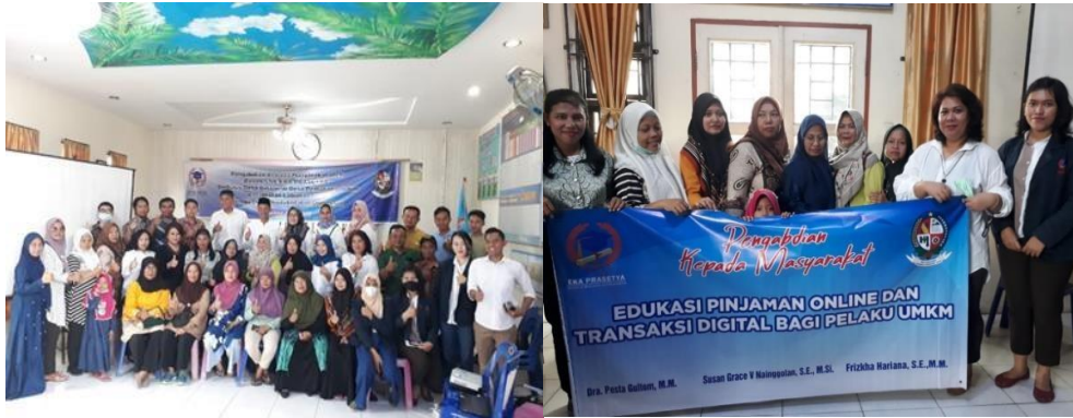
Gambar 4. Foto Bersama antara para akademisi STIE Eka Prasetya, para perangkat desa, dosen, mahasiswa, dan peserta PkM.