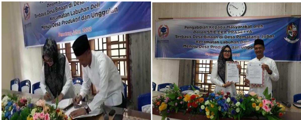
Gambar 2. Tanda Tangan MOU antara Ketua STIE Eka Prasetya dengan Kepala Desa Pematang Johar. Desa Pematang Johar sebagai Desa Binaan STIE Eka Prasetya.

Pinjaman online adalah pinjaman yang ditawarkan oleh penyedia layanan keuangan berbasis online (digital), dan pengguna dari fasilitas pinjaman berbasis digital ini perlu di edukasi kepada para UMKM desa Pematang Johar melalui program pengabdian kepada masyarakat. Pelaksanaan kegiatan diawali kata sambutan dari Ketua STIE Eka Prasetya, dan dilanjutkan penanda tangan MOU antar Ketua STIE Eka Prasetya dan Kepala Desa Pematang Johar. Dan hasil kerjasama yang sudah disepakati desa Pematang Johar yang terletak di Kecamatan Medan Deli merupakan Desa Binaan STIE Eka Prasetya dengan harapan kedepannya desa Pematang Johar menjadi desa produktif dan unggulan.