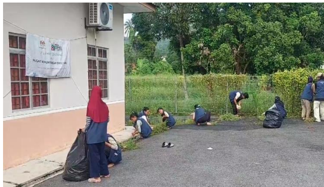
Gambar 10. Tim UNNES Giat Internasional sedang melakukan gotong royong di Pusat Komuniti Desa (PKD) Kampung Jawa

Selain melaksanakan kegiatan gotong royong di Kolam Air Panas Kampung Jawa, kegiatan gotong royong juga dilaksanakan di Pusat Komuniti Desa (PKD) Kampung Jawa pada Hari Senin, 03 Juni 2024. PKD merupakan tempat berkumpulnya masyarakat Kampung Jawa untuk melaksanakan berbagai aktivitas, seperti kegiatan administrasi, pusat latihan komunitas, tempat berkumpulnya wirausahawan Amanah Ikhtiar Malaysia (AIM) dan lain-lain menjadikan tempat ini cukup vital dan harus dijaga kebersihannya. Melihat kondisi sekitar PKD yang banyak ditumbuhi rumput dan gulma liar, maka mahasiswa UNNES Giat Internasional berinisiatif untuk melakukan bersih-bersih PKD untuk mencabut rumput dan menghilangkan gulma yang ada di sekitar PKD. Rumput dan gulma tidak hanya mengurangi estetika, namun juga menjadi sarang serangga seperti ulat, dan lama kelamaan juga dapat merusak tembok dan pagar yang ada di PKD.