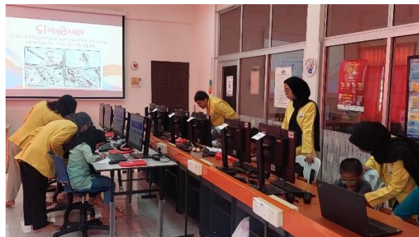
Gambar 6. Canva Class bersama anak-anak Kampung Jawa

Kegiatan lain yang dilakukan sebagai bentuk pengabdian pada anak-anak Kampung Jawa, Hulu Langat, Selangor, Malaysia ini juga meliputi pemberian materi dan praktek seputar kelas digital, yakni berupa pengenalan Canva class . Kegiatan ini dilaksanakan selama 2 kali, masing-masing pertemuan dihadiri oleh 10 anak-anak yang berbeda dengan rentang usia 8-13 tahun, yakni pada Hari Selasa, 28 Mei dan Kamis, 30 Mei 2024. Penyelenggaraan Canva class dilaksanakan 2 kali, dikarenakan antusias anak-anak yang luar biasa dalam mengikuti kegiatan ini, serta penyesuaian terhadap jumlah komputer yang terdapat di Pusat Komuniti Desa Kampung Jawa. Penyelenggaraan kelas Canva ini sebagai salah satu wujud implementasi program kerja berbasis pengenalan dunia digital. Canva merupakan website dan aplikasi desain grafis berbasis online yang berguna untuk membantu seseorang dalam membuat desain atau visualisasi yang menarik (Kharissidqi & Firmansyah, 2022). Aplikasi editing ini juga memiliki beberapa kelebihan antara lain: memiliki berbagai rancangan yang menarik secara estetis, dapat meningkatkan kreativitas anak-anak dan bahkan dapat membantu dalam membuat media penunjang pembelajaran, serta penggunaannya yang mudah dan efisien, terutama dari segi waktu (Sandi et al. , 2024).