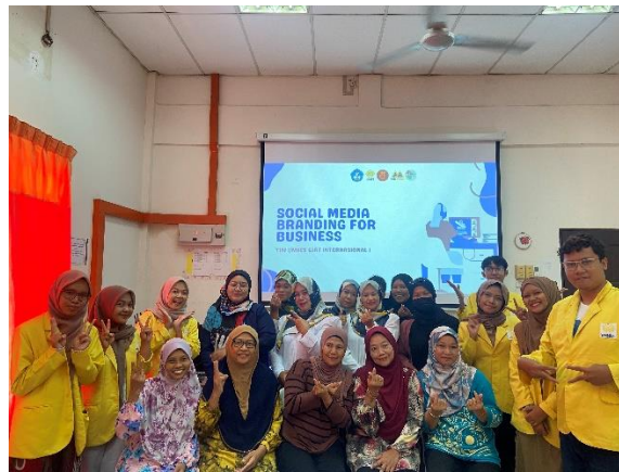
Gambar 2. Workshop pemberian materi social media branding for business kepada wirausahawan Amanah Ikhtiar Malaysia

Setelah materi selesai dipaparkan, kegiatan selanjutnya adalah sesi tanya jawab dari para wirausahawan. Para wirausahawan sangat antusias untuk bertanya mengenai penggunaan Instagram business , cara membuat konten yang menarik, serta pembuatan logo usaha yang kreatif. Kegiatan tanya jawab berlangsung dua arah dan dilakukan secara terbuka dengan pemaparan contoh nyata. Setelah sesi tanya jawab selesai, kegiatan dilanjutkan dengan proses pembuatan akun Instagram business bagi para wirausahawan yang belum memiliki akun business sebelumnya. Setiap wirausahawan didampingi oleh 1 mahasiswa sehingga proses pembuatan akun dapat berjalan dengan baik dan lancar. Pada kegiatan ini juga dilakukan pendataan seluruh unit bisnis para wirausahawan untuk dibantu dalam pembuatan logo dan banner usahanya, dengan tujuan para wirausahawan akan memiliki logo usaha yang menarik serta banner yang informatif untuk menarik pelanggan.