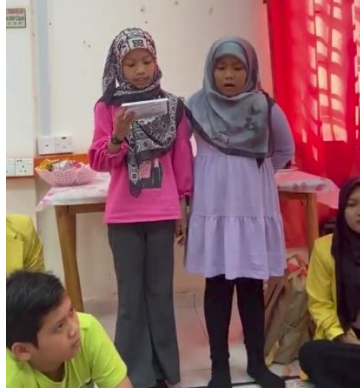
Gambar 4. Anak-anak melakukan public speaking di depan teman-temannya

berbicara di depan umum yang baik dan benar bagi anak-anak, serta memberikan pengajaran untuk mendeskripsikan diri sendiri kepada orang lain. Penerapan public speaking sejak dini akan mampu membuat anak lebih percaya diri dan berani dalam berbicara, anak-anak juga akan lebih berani untuk menyampaikan pendapat mereka di depan khalayak umum. Program pengabdian ini juga dilatarbelakangi dari pendapat Wibawa et al. , (2014) yang mengemukakan bahwa ketakutan berbicara di depan umum menduduki peringkat yang lebih tinggi dibandingkan takut pada ketinggian. Hal ini disebabkan berbicara di depan umum tidak hanya sekadar menyampaikan pesan, namun membuat pesan yang disampaikan lebih mudah dimengerti kepada lawan bicara (Asriandhini et al. , 2020). Oleh karena itu, pelatihan public speaking sejak dini sangat diperlukan untuk membuat anak-anak lebih percaya diri, dan upaya untuk mencegah timbulnya permasalahan psikologis yang menghambat perkembangan diri seseorang (Jalal et al. , 2023).