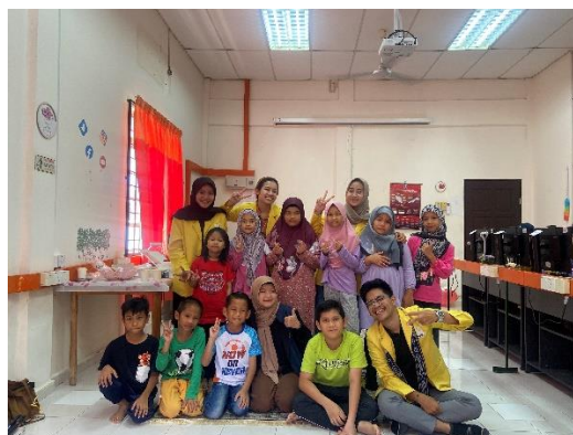
Gambar 5. Kelas public speaking bersama anak-anak Kampung Jawa

Capaian yang berhasil diraih melalui kegiatan ini meliputi keberanian anak-anak yang semakin bertambah untuk berbicara di depan khalayak umum, anak-anak mampu mendeskripsikan tentang dirinya dengan baik, serta mampu mengenal sastra dasar, seperti berdongeng dan berpantun ria bersama teman-teman, yang diharapkan dapat