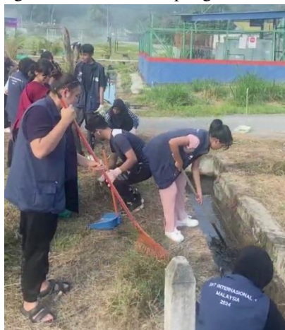
Gambar 9. Tim UNNES Giat Internasional sedang melakukan gotong royong di sekitar kawasan Kolam Air Panas Kampung Jawa