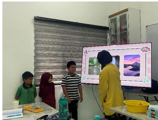
Gambar 7. Anak-anak mencoba menebak kosakata berbahasa Arab dari gambar yang ditampilkan

Kegiatan Arabic class dimulai dengan pemberian materi melalui media PPT mengenai berbagai kosakata ( mufrod ) yang berkaitan dengan lingkungan. Agar mudah dipahami dan menarik bagi anak-anak, setiap kosakata juga diberikan gambar menarik yang sesuai. Setelah itu, anak-anak dilatih untuk dapat membaca, menulis, serta menghafal setiap kosakata yang telah diberikan. Bagi anak-anak yang mampu menjawab pertanyaan, atau menebak kosakata dan percaya diri juga diberikan kesempatan untuk maju ke depan serta diberikan hadiah sebagai pemantik kelas. Anak-anak terlihat sangat antusias maju ke depan untuk menjelaskan kosakata yang telah mereka mengerti. Hadiah yang diberikan juga membuat mereka semakin senang dan semangat untuk belajar. Pada akhir kelas, diberikan ice breaking menggunakan lagu berbahasa Arab ' lau anta sa'idun '. Anak-anak diminta untuk bernyanyi dan memaknai arti lagu yang dinyanyikan bersama para mahasiswa selaku instruktur.