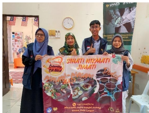
Gambar 3. Pembagian banner kepada para wirausahawan Amanah Ikhtiar Malaysia

Hasil yang dicapai dari kegiatan ini meliputi tersampainya materi terkait dengan cara meningkatkan visibilitas usaha melalui media Instagram business bagi pemula, tersampainya informasi terkait dengan cara meningkatkan interaksi dengan pelanggan melalui Instagram, terbentuknya 8 akun Instagram business bagi para wirausahawan, serta terbentuknya 6 logo usaha dan 11 banner bagi para wirausahawan Amanah Ikhtiar Malaysia yang diharapkan dapat menunjang promosi usaha dan menarik lebih banyak pelanggan.