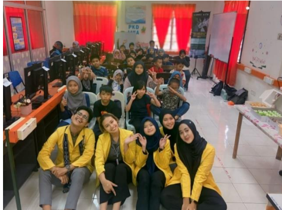
Gambar 8. Tim UNNES Giat Internasional bersama anak-anak Kampung Jawa saat melaksanakan English Class

dengan diberikan kegiatan berupa permainan guess the picture , dan alphabetic and number . Anak-anak diminta untuk menebak kosakata dari gambar yang disediakan, serta belajar untuk mengeja dan berhitung dengan menggunakan Bahasa Inggris. Pemberian hadiah bagi anak-anak yang aktif selama kelas juga membuat suasana menjadi meriah dan seru. Berdasarkan hasil kuesioner pasca pemberian materi, diketahui bahwa 96% anak-anak sudah dapat mengenal abjad dan angka dalam Bahasa Inggris dengan sangat baik. 76% anak-anak sudah mampu memperkenalkan diri dan berdialog dengan kalimat berbahasa Inggris, serta 80% anak-anak sudah dapat memahami kosa kata percakapan sehari-hari dalam Bahasa Inggris.