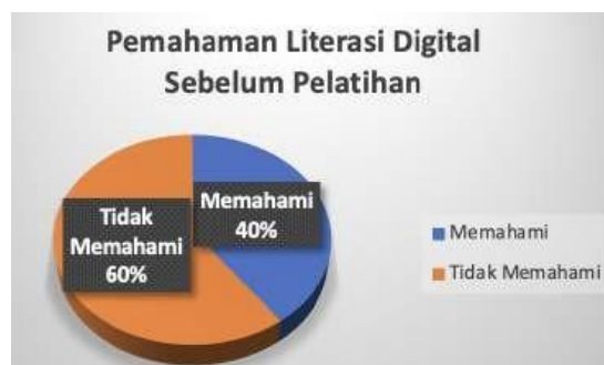
Gambar 3. Pengukuran Pemahaman Literasi Digital Sebelum PKM

Pada tahap studi pendahuluan, data diperoleh melalui survei awal untuk mengukur tingkat literasi digital, pemahaman mengenai penguasaan teknologi informasi, dan penerapan keamanan digital di masyarakat Desa Sindangbarang. Survei ini melibatkan 25 responden yang dipilih secara acak. Gambar 3 menunjukkan bahwa 40% masyarakat memiliki pemahaman tentang literasi digital, sedangkan 60% lainnya belum memahami.