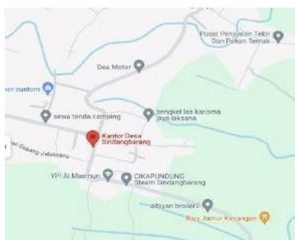
Gambar 1. Peta Desa Sindangbarang (Desa Sindangbarang, 2024)

Dengan berbagai potensi yang dimiliki dan upaya digitalisasi yang mulai diterapkan, Desa Sindangbarang memiliki peluang besar untuk meningkatkan kualitas hidup warganya serta memperluas konektivitas dengan dunia luar. Peningkatan literasi digital, khususnya bagi pelaku UMKM dan generasi muda, akan menjadi faktor kunci dalam mendukung pertumbuhan ekonomi berbasis teknologi. Jika pelaku UMKM ingin memanfaatkan teknologi digital untuk meningkatkan pemasaran produk, maka peningkatan kualitas produk serta pemahaman strategi pemasaran berbasis digital sangat diperlukan agar mereka dapat bersaing di pasar yang lebih luas (Amelia, 2024). Pada Gambar 1 merupakan gambaran peta desa Sindangbarang.