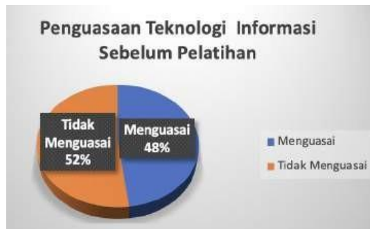
Gambar 4. Pengukuran Pemahaman Penguasaan Teknologi Informasi Sebelum PKM

Pengukuran tingkat penguasaan teknologi informasi di masyarakat Desa Sindangbarang juga dilakukan. Gambar 4 menunjukkan bahwa 48% masyarakat menguasai teknologi informasi, sementara 52% lainnya tidak menguasai.