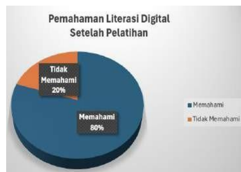
Gambar 8. Pengukuran Pemahaman Literasi Digital Setelah PKM

Tahap berikutnya adalah pelaksanaan evaluasi dan monitoring terhadap hasil kegiatan pengabdian kepada masyarakat. Pada Gambar 8 terlihat adanya peningkatan pemahaman masyarakat terkait literasi digital, dengan 80% peserta yang telah memahami materi, sementara 20% lainnya masih belum memahaminya.