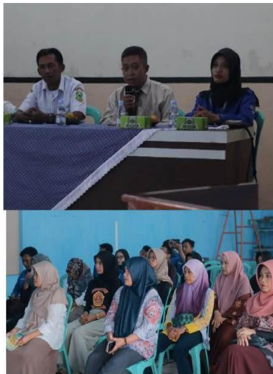
Gambar 7. Kegiatan Pengabdian Kepada Masyarakat

Pada proses pelaksanaan, peserta yang merupakan kumpulan masyarakat Desa Sindangbarang berjumlah 25 orang, dengan distribusi frekuensi peserta berdasarkan jenis kelamin yang ditunjukkan pada tabel 1. Komposisi peserta berdasarkan gender dapat memengaruhi hasil pelatihan, meskipun pengaruh tersebut tidak selalu bersifat langsung dan mungkin tergantung pada berbagai faktor lainnya, seperti jenis pelatihan, materi yang diajarkan, serta konteks sosial dan budaya peserta. Pelatihan ini disesuaikan dengan kebutuhan atau preferensi belajar masing-masing gender sehingga bisa lebih efektif dalam meningkatkan hasil pembelajaran. Misalnya, dengan memvariasikan metode pengajaran, baik laki-laki maupun perempuan dapat lebih mudah memahami dan mempraktikkan keterampilan yang diajarkan