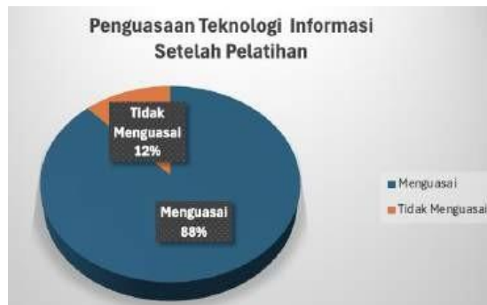
Gambar 9. Pengukuran Pemahaman Teknologi Infomasi Setelah PKM

Hasil evaluasi penguasaan teknologi informasi yang ditunjukkan pada gambar 9 memperlihatkan adanya peningkatan, dengan 88% peserta yang menguasai dan 12% yang belum menguasai.