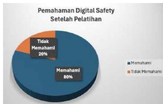
Gambar 10. Pengukuran Pemahaman Digital Safety Setelah PKM

Hasil evaluasi pemahaman digital safety yang terlihat pada gambar 10 menunjukkan adanya peningkatan, dengan 80% peserta yang menguasai materi dan 20% yang belum menguasai.