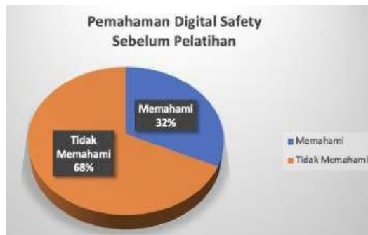
Gambar 5. Pengukuran Pemahaman Digital Safety Sebelum PKM

Pengukuran tingkat pemahaman tentang digital safety di masyarakat Desa Sindangbarang juga dilakukan. Gambar 5 menunjukkan bahwa 32% masyarakat memahami digital safety , sementara 68% lainnya tidak memahaminya.