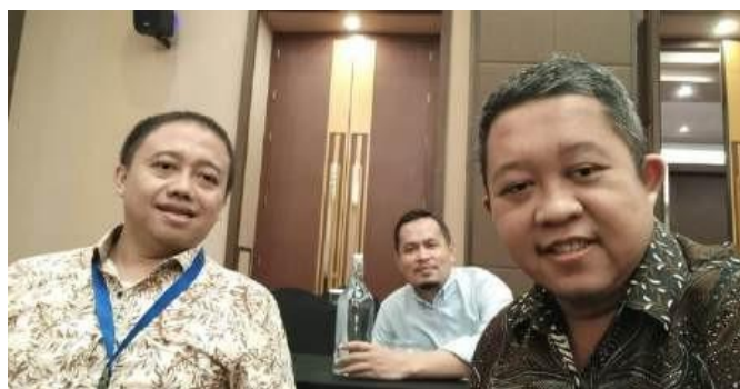
Gambar 6. Tim Menyusun Rencana Kegiatan

Hasil dari studi pendahuluan menunjukkan beberapa masalah utama yang dihadapi oleh masyarakat Desa Sindangbarang, antara lain rendahnya literasi digital, kurangnya keterampilan dalam penguasaan teknologi informasi, dan minimnya pemahaman tentang keamanan digital. Langkah berikutnya adalah tim menyusun rencana kegiatan bersama perangkat desa dan perwakilan masyarakat. Gambar 6 menunjukkan proses diskusi untuk merancang rencana kegiatan dan mengembangkan materi pelatihan yang akan digunakan.