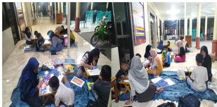
Gambar 3. Proses Kegiatan Pendampingan Belajar Membaca Permulaan

Tahap ketiga yaitu dilakukan kegiatan pendampingan membaca permulaan menggunakan metode Orton-Gillingham oleh mitra setiap 1 minggu 3 kali yang bertempat di Balai Desa Kalipecabean. Langkah-langkah mitra saat pendampingan belajar membaca yaitu: 1) Mitra meminta siswa untuk menuliskan huruf A-Z. 2) Siswa menirukan pelafalan bunyi huruf vokal yang dibunyikan oleh mitra. 3) Siswa diminta melafalkan bunyi huruf vokal secara acak melalui media kartu huruf atau alphabet magnetic . 4) Siswa menirukan pelafalan bunyi huruf konsonan yang dibunyikan oleh mitra. 5) Setelah itu siswa mulai mempelajari suku kata. 6) Setelah itu melakukan review suku kata secara acak menggunakan media kartu huruf atau alphabet magnetic . 7) Siswa mulai belajar membaca dengan modul yang berisi suku kata-kata-kalimat.