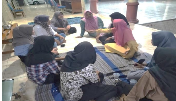
Gambar 4. Evaluasi Setiap Selesai Pertemuan.

membaca untuk mencari solusi. Evaluasi akhir dilakukan dengan cara melakukan wawancara terhadap orang tua siswa untuk melihat peningkatan membaca atau perubahan dalam kemampuan membaca siswa.