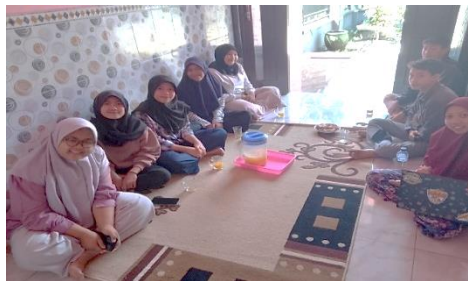
Gambar 2. Sosialisasi kepada Mitra(IPNU-IPPNU)

Tahap kedua yaitu sosialisasi kepada mitra yang dilakukan pada tanggal 19 Juli 2023 yang diikuti oleh anggota IPNU-IPPNU sebanyak 10 orang di desa Kalipecabean, Respon anggota IPNU-IPPNU dalam pengenalan awal mendukung sepenuhnya kegiatan ini. Kemudian dilakukan pelatihan membaca permulaan menggunakan metode Orton-Gillingham kepada mitra IPNU-IPPNU. Pelatihan dilaksanakan sebanyak 4 kali dalam waktu satu bulan. Anggota IPPNU-IPPNU dibekali cara penggunaan metode Orton-Gillingham saat pelatihan. Pada pertemuan pertama saat pelatihan, anggota IPNU-IPPNU diajarkan cara bunyi huruf serta praktik melafalkan bunyi huruf metode Orton-Gillingham . Pertemuan kedua dan ketiga, anggota IPNU-IPPNU mengajarkan cara membaca dengan menggunakan modul yang didalamnya berisi bacaan seperti suku kata, kata, dan kalimat. Pada pertemuan terakhir, anggota IPNU-IPPNU melakukan simulasi mengajar membaca menggunakan metode Orton-Gillingham antar anggota. Sehingga ketika anggota IPNU-IPPNU mendampingi siswa yang mengalami kesulitan belajar membaca, anggota IPNU-IPPNU dapat menerapkan metode Orton-Gillingham seperti yang diajarkan saat pelatihan.