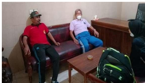
Gambar 1. Survei Lokasi di Desa Kalipecabean

Tahap pertama dari kegiatan ini adalah survei lokasi awal dengan tujuan untuk mengetahui permasalahan dan potensi yang ada di desa tersebut. Langkah selanjutnya adalah mengajukan izin dan berkonsultasi dengan berbagai pihak kepala desa Kalipecabean, kepala SDN Kalipecabean dan anggota IPNU-IPPNU desa Kalipecabean. Respons pihak-pihak tersebut sangat baik dan mendukung keberadaan kegiatan ini. Setelah dilakukan konsultasi dengan berbagai pihak tim memulai seleksi siswa dalam beberapa tahap untuk mengetahui kemampuan membaca siswa SDN Kalipecabean.